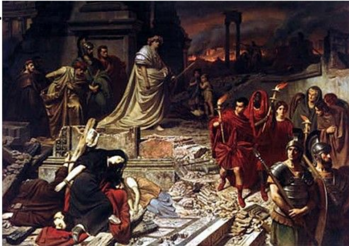
Нерон и пожар Рима

В 64 г. н.э. в Риме вспыхнул пожар. Огонь быстро распространялся по городу, перескакивая через узкие улочки от дома к дому. Многие римляне попытались тушить пожар, но ветер раздувал пламя. В огне оказался почти весь город.