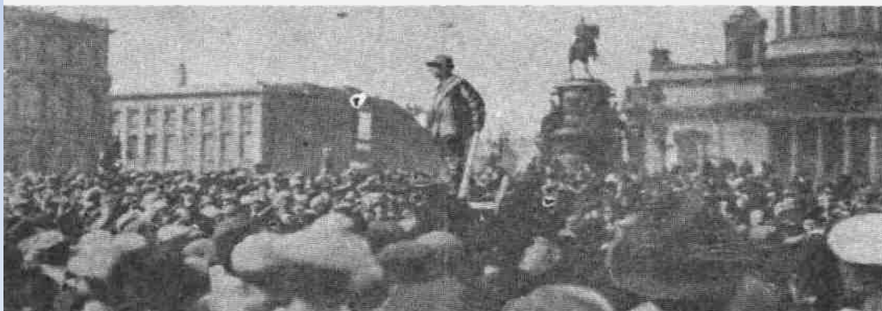
У Государственного Совета.