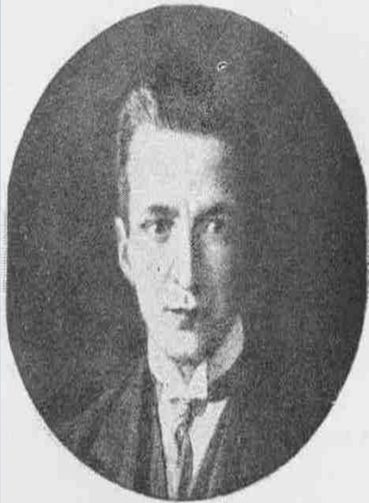
Лидер трудовиков, член партии социалистов-революционеров, Керенский