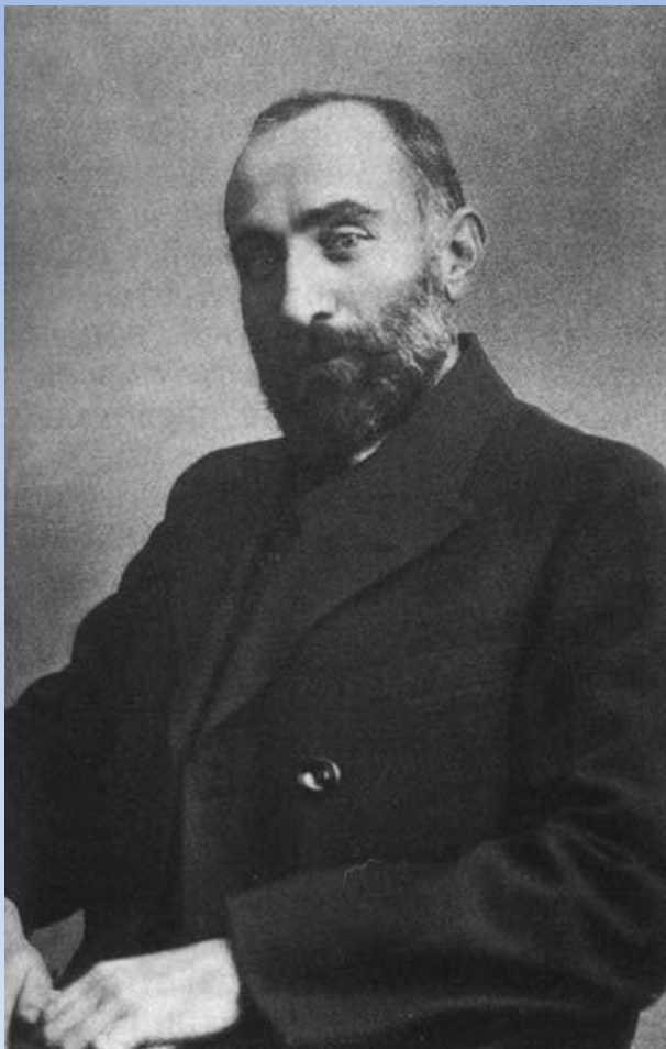
Чхеидзе Николай Семенович