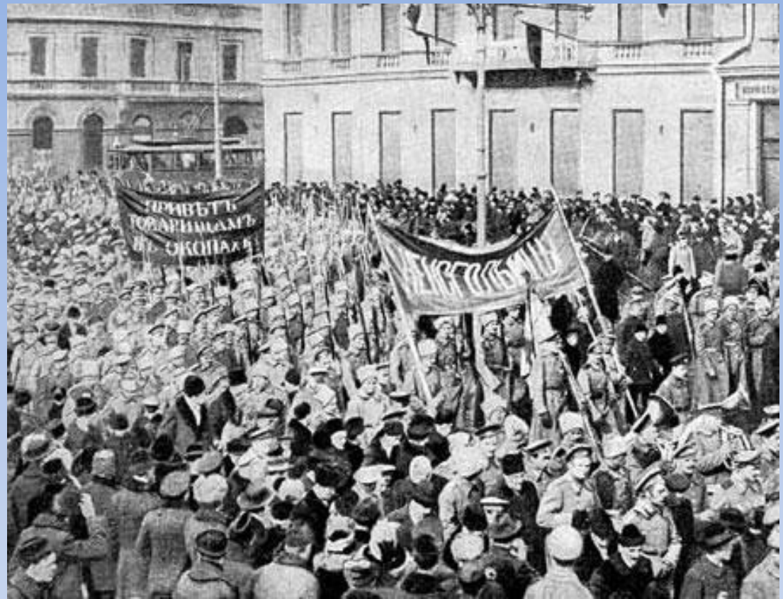
Солдатская демонстрация в Петрограде февраль 1917 года