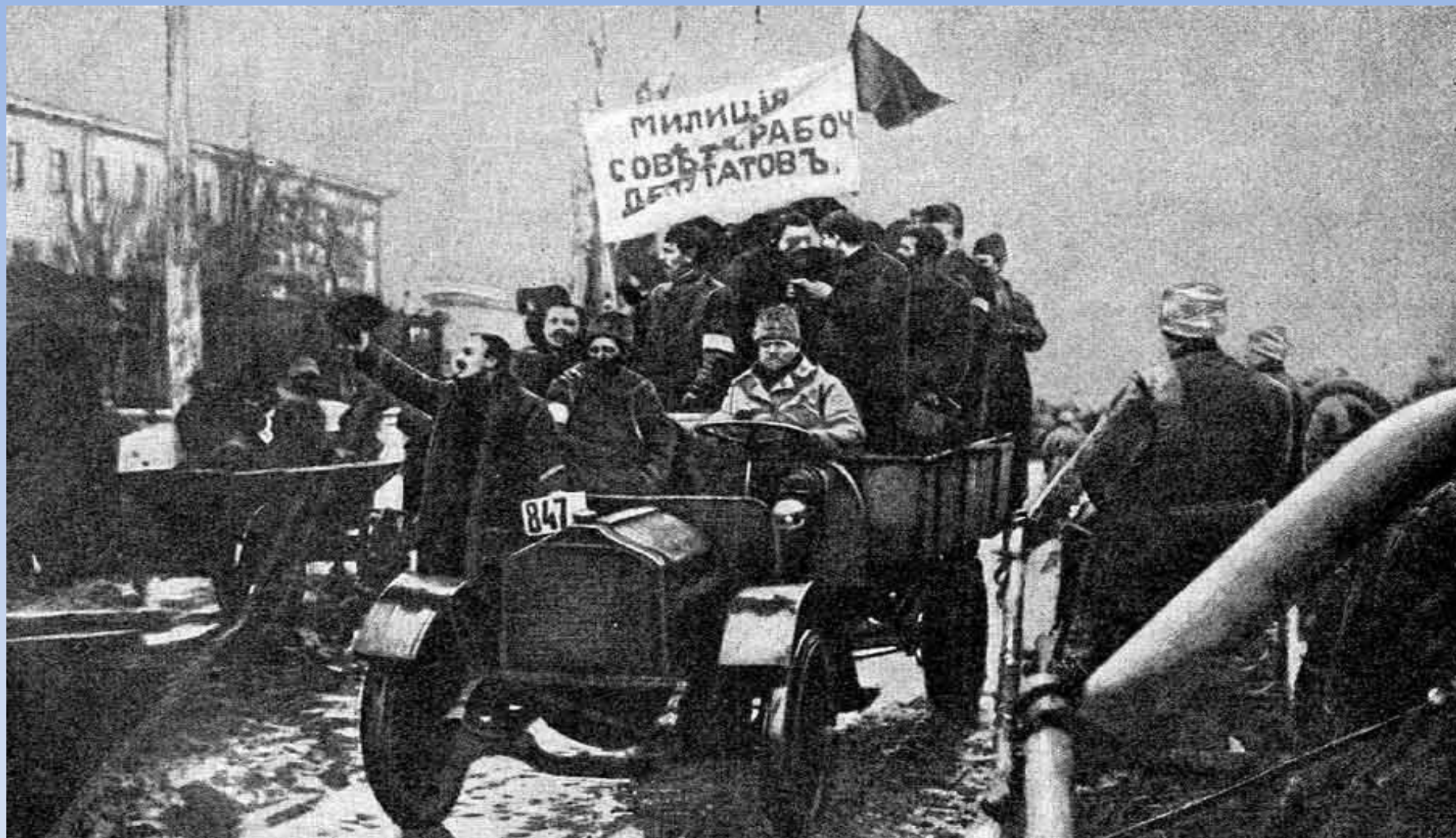
Петроград. Февраль 1917 года