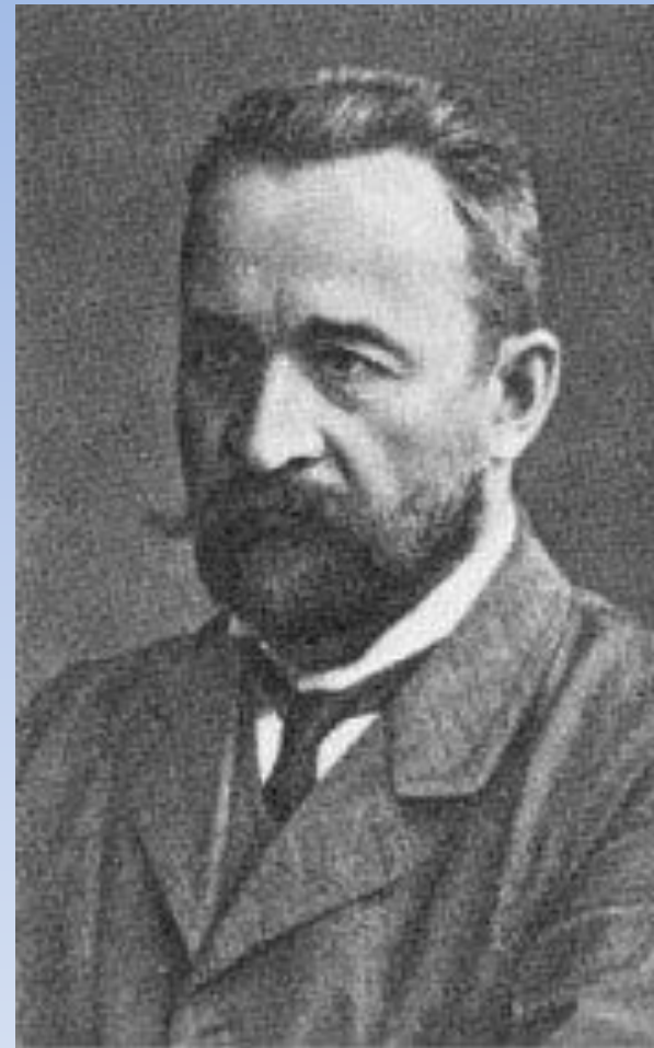
Львов Георгий Евгеньевич - князь, русский политик