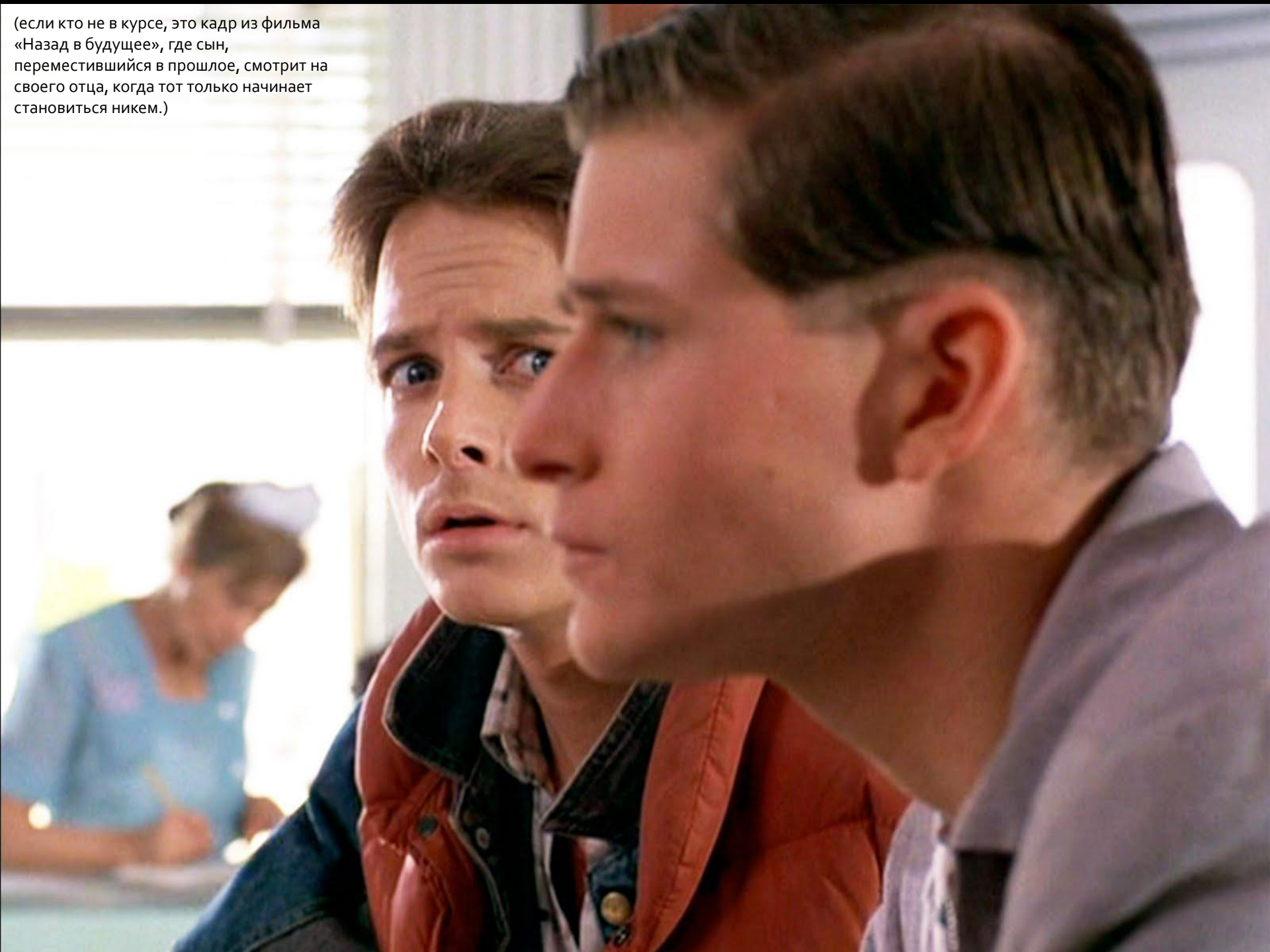
(если кто не в курсе, это кадр из фильма «Назад в будущее», где сын, переместившийся в прошлое, смотрит на своего отца, когда тот только начинает становиться никем.)