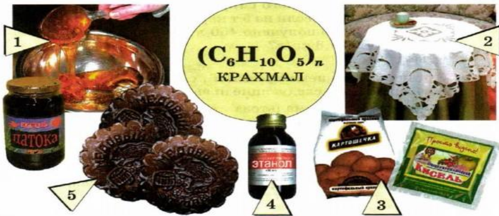
Рис. 67. Применение крахмала: 1 — получение патоки; 2 — подкрамливание белья; 3 — приготовление киселей; 4 — производство этанола; 5 — выпечка кондитерских изделий

Медицинада түрлі дәрі–дәрмектер алуға және қоспа түрінде таблеткалар мен жағатын майлар жасауға пайдаланады.