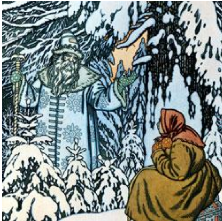
Сказка «Морозко», 1932 год