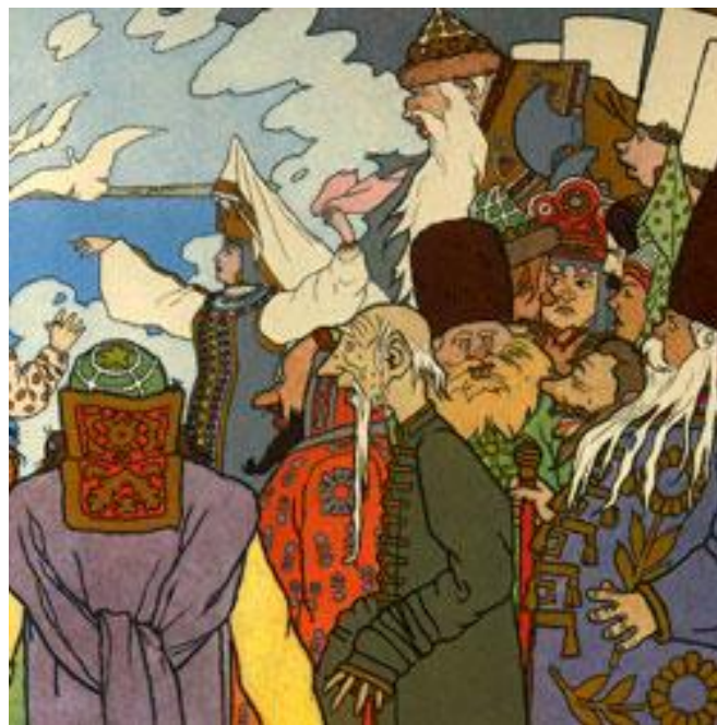
«Царевна-Лягушка» (1899-1900 годы)