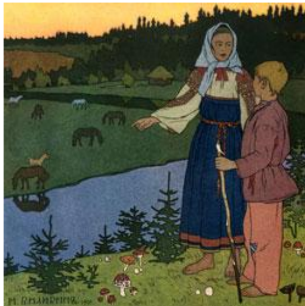
«Сестрица Аленушка и братец Иванушка», 1901 год

Известность Билибину принесли иллюстрации к русским народным сказкам: