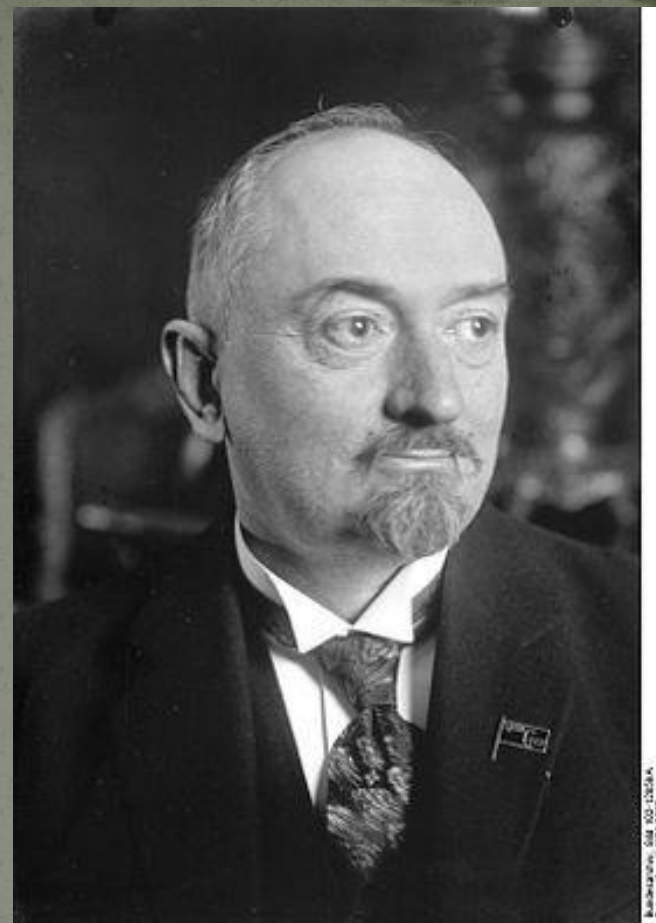
Г.В. Чичерин нарком по иностранным делам

Германия - первая крупная капиталистическая держава, признавшая Советскую Россию