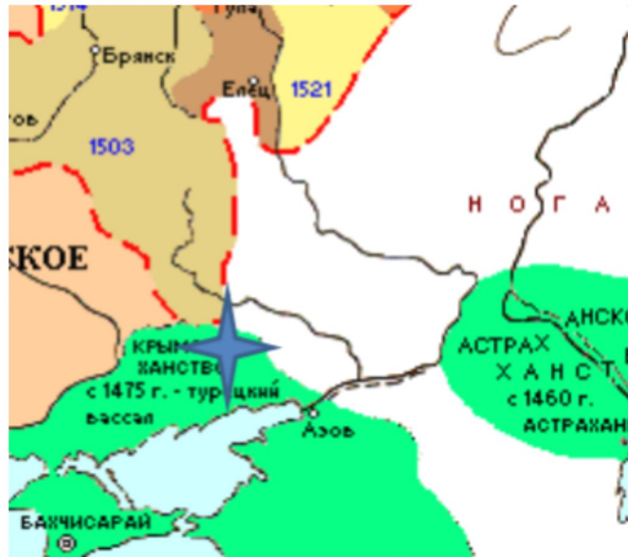
Расположение Донецкого края на политической карте Восточной Европы в начале XVI в.

1526 г. – первое упоминание в письменных источниках о местности «Святые горы» на р. Северский Донец.