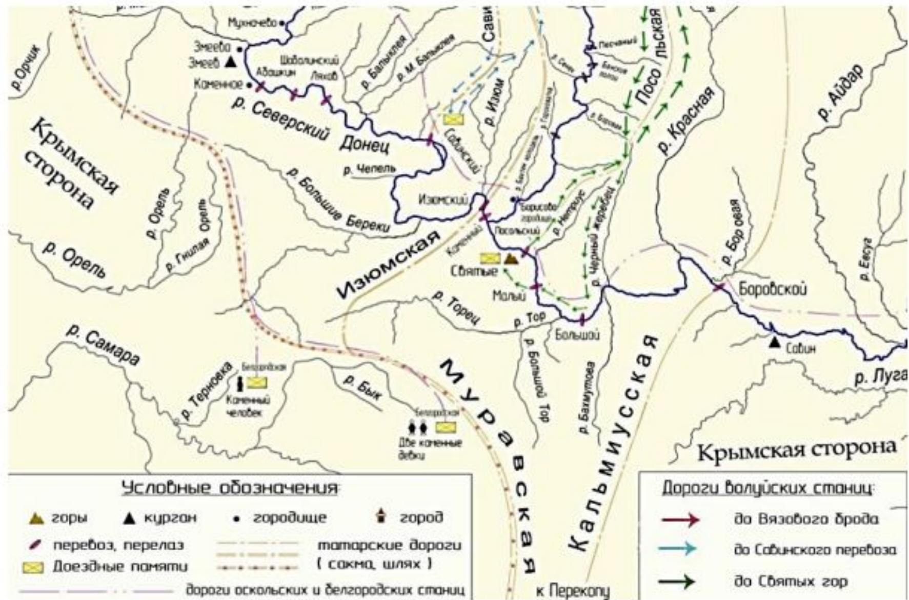
Карта-схема станичной службы на южнорусской окраине в 1630 г.