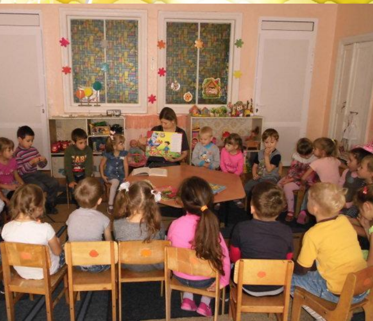
Чтение художественных произведений