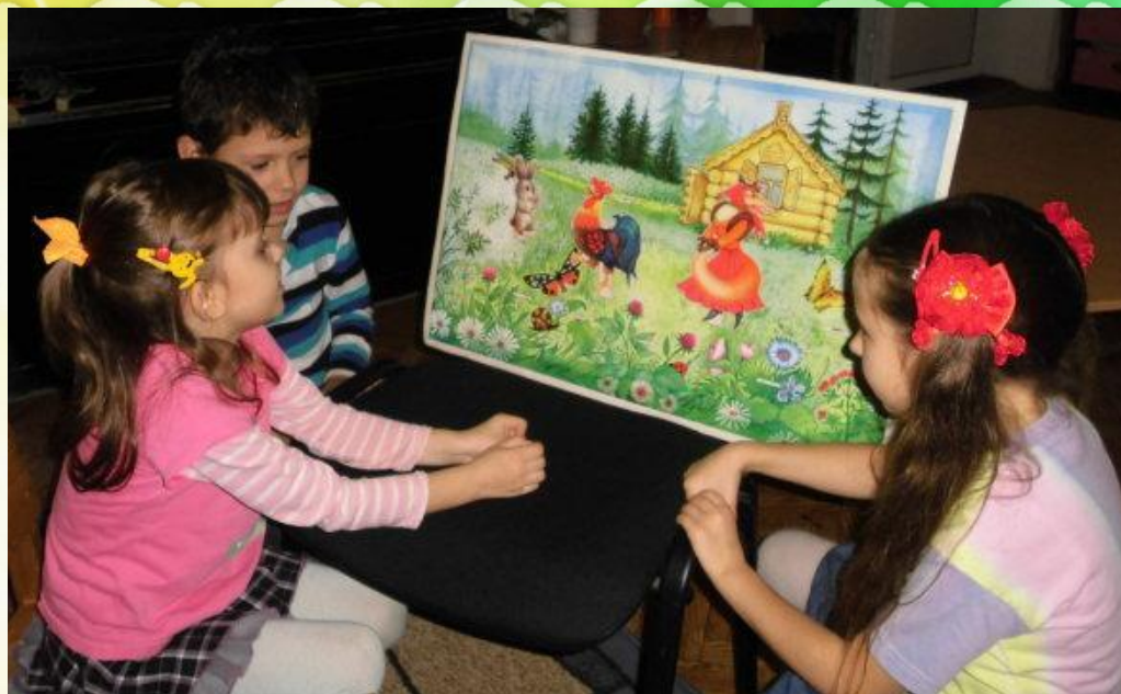
Театрализация сказок по ролям