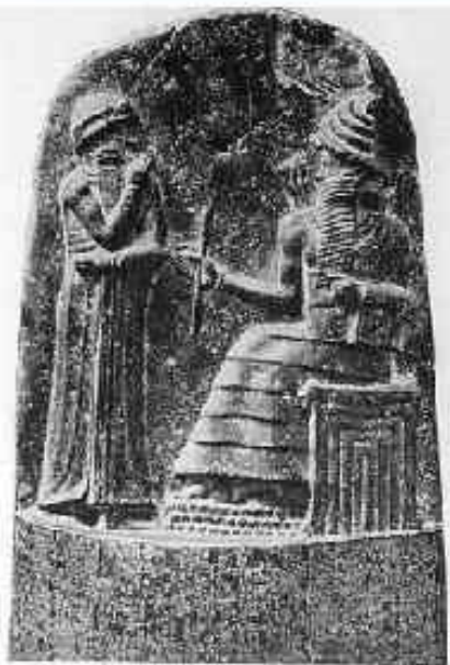
Часть стелы с законами Хаммурапи (XVIII век до н. э.)