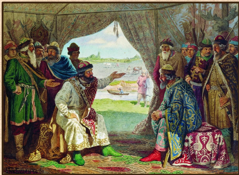
Кившенко А. «Владимир Мономах на съезде русских князей».

Владимиру Мономаху и впоследствии Мстиславу ненадолго удалось восстановить былое единство. После смерти Мстислава Киевская Русь окончательно распалась на полтора десятка княжеств-государств. Наступил период, получивший в истории название периода раздробленности или удельного периода.