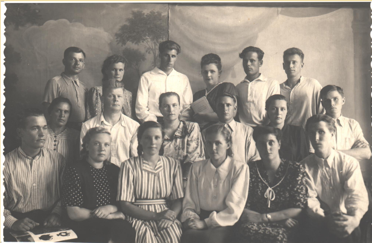
Лысковское педучилище 1952 год