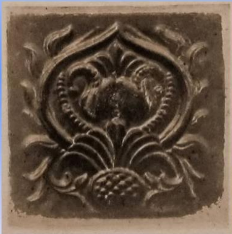
Церковь Воскресения Христова в Ростове (конец XVII в.)