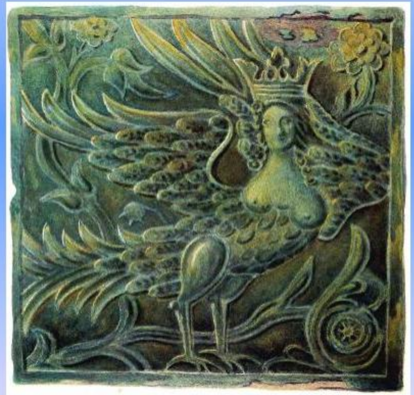
Декор паперти трапезной палаты Борисоглебского монастыря (конец XVII в.)