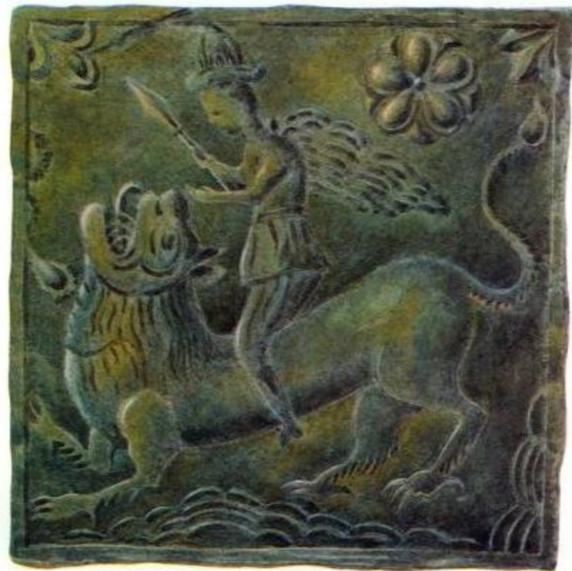
Муравленные изразцы Московского производства в декоре паперти трапезной палаты Борисоглебского монастыря. 90-е годы 17 в.