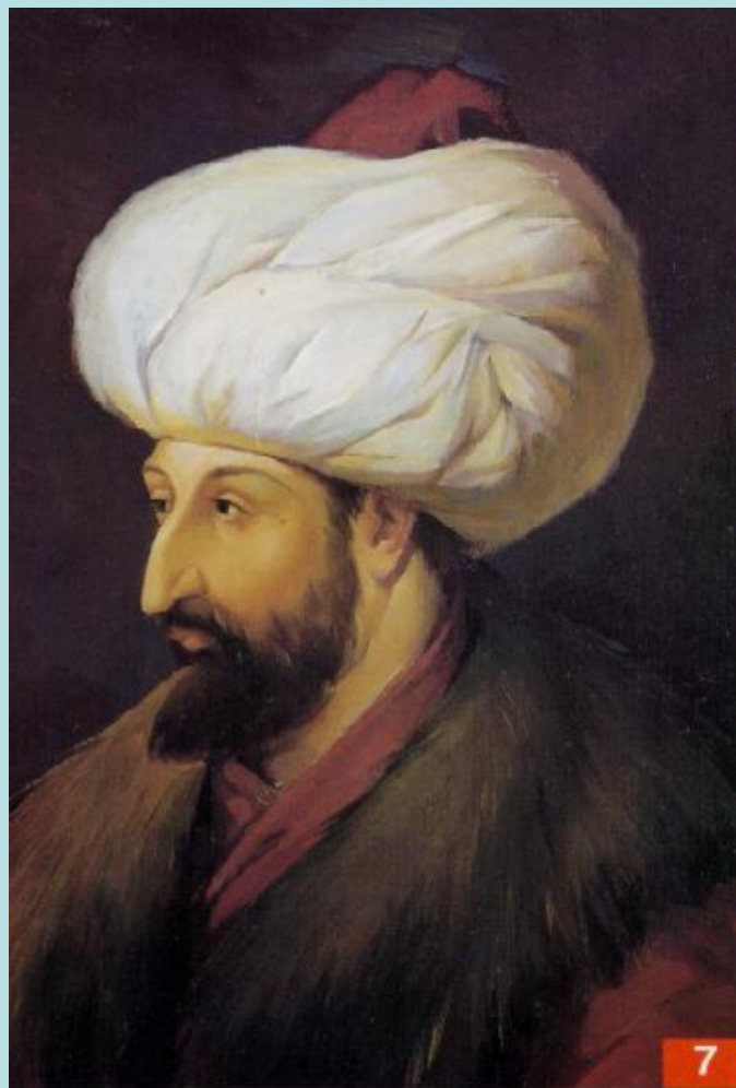
FATİH SULTAN MEHMED H. 855-886 M. 1451-1481 55x65 Tuval / Yağlı Boya

В 1453 году османская империя во главе с Мехмедом II Завоевателем разгромила остатки Восточной Римской империи.