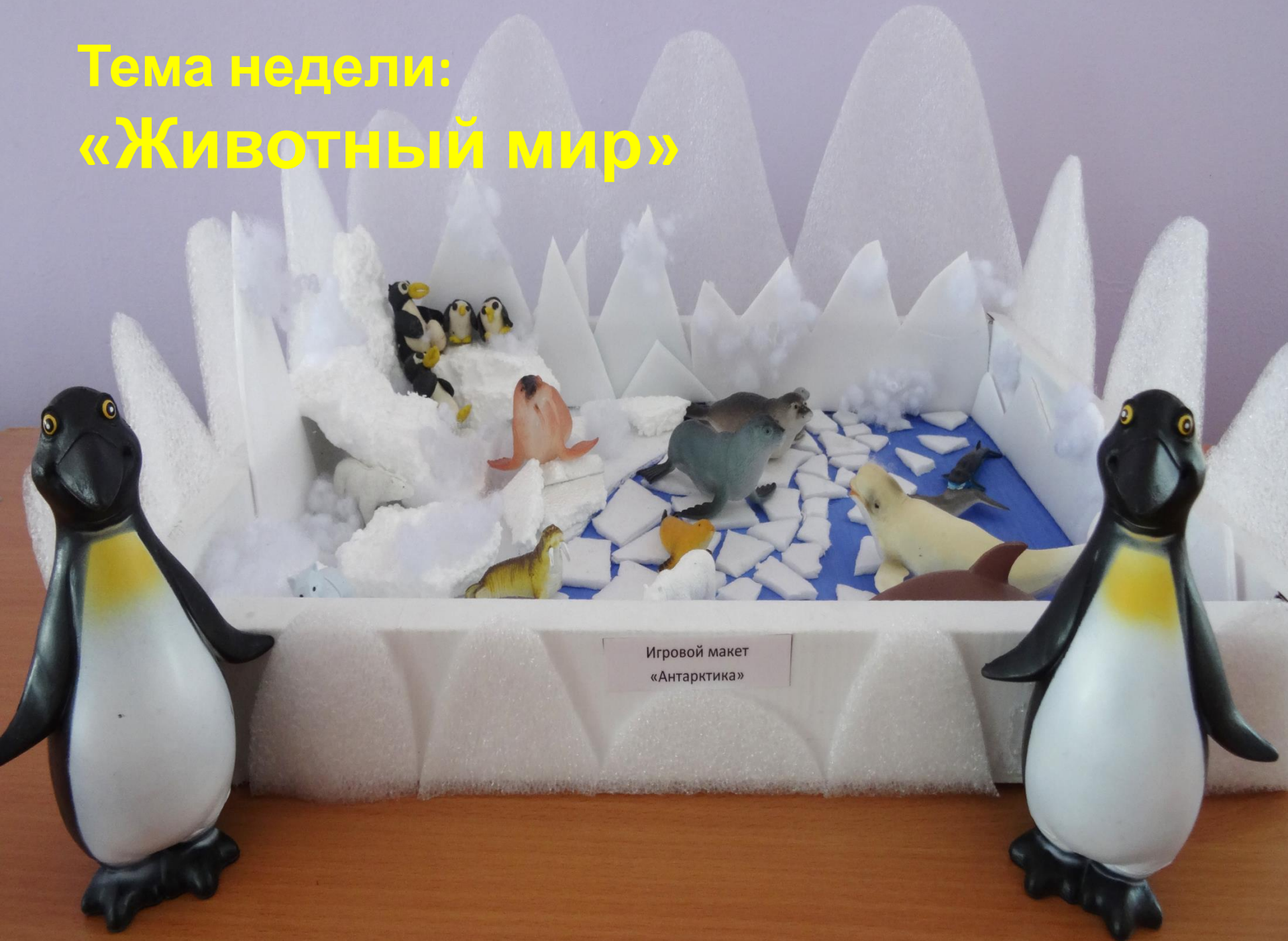
Игровой макет «Антарктика»