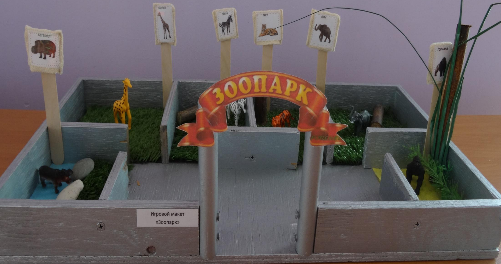
Игровой макет «Зоопарк»