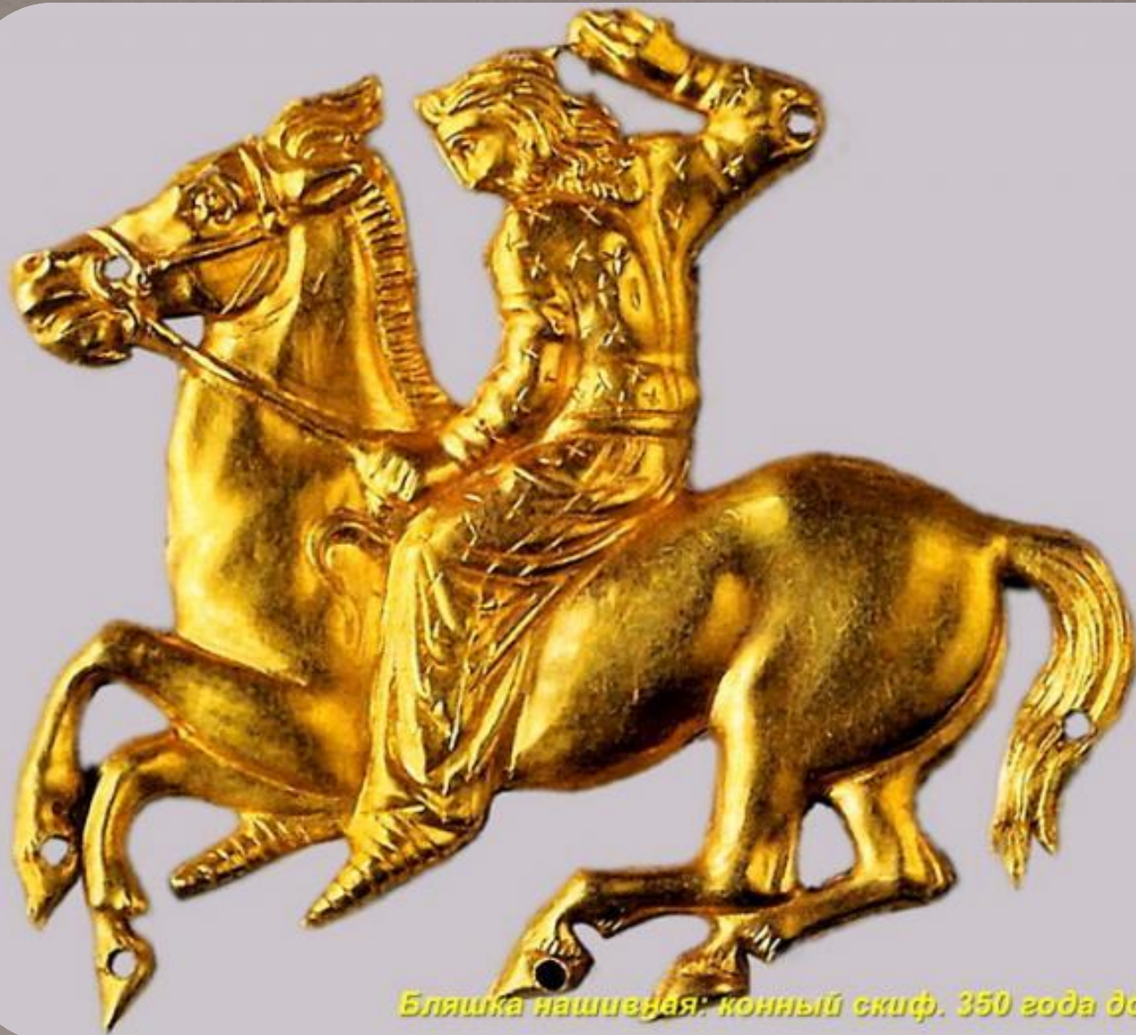
Бляшка нащипная: конный скиф. 350 года до н. э.