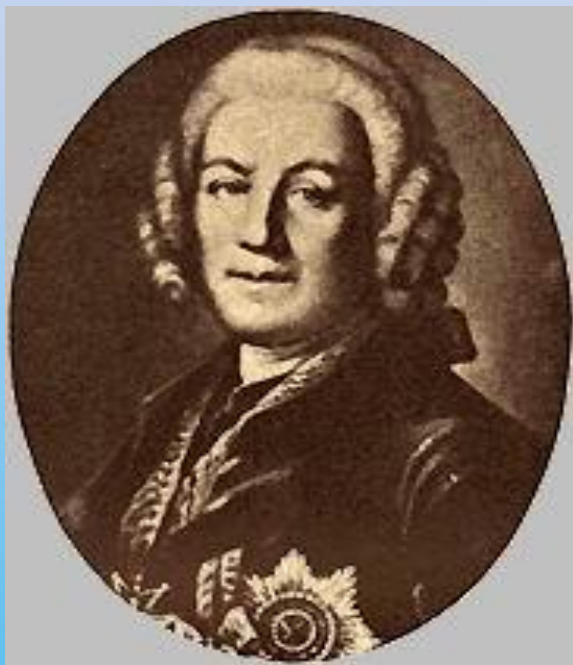
Канцлер А.П. Бестужев