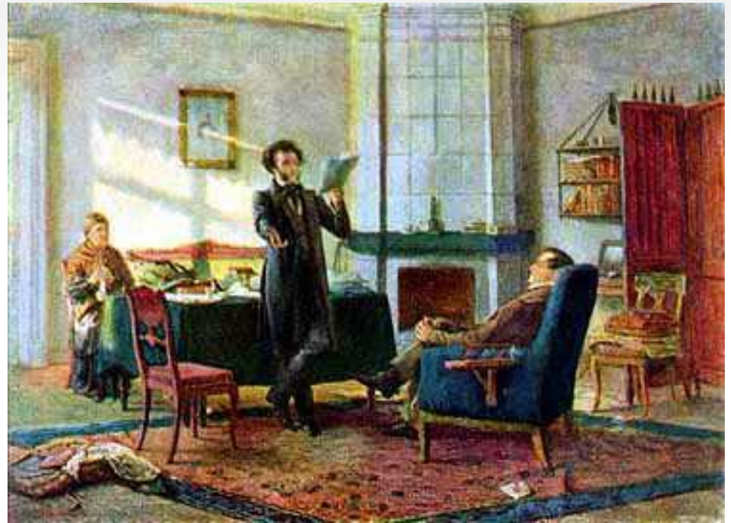
Пушкин в селе Михайловском (Пуцин у Пушкина). Н.Н. Ге. 1875 г.

За три года ссылки написаны "Кавказский пленник", "Бахчисарайский фонтан", а также "Узник", "Песнь о Вещем Олеге». Начат роман в стихах "Евгений Онегин".