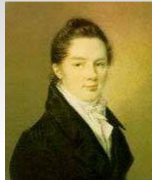
Иван Иванович Пу́цин

Пушкин сохранил лицейскую дружбу и культ Лицея на всю жизнь.