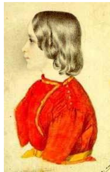
Младший сын, Григорий Александрович Пушкин (1835-1913г.)