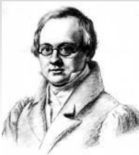
Антон Антонович Дельви́г