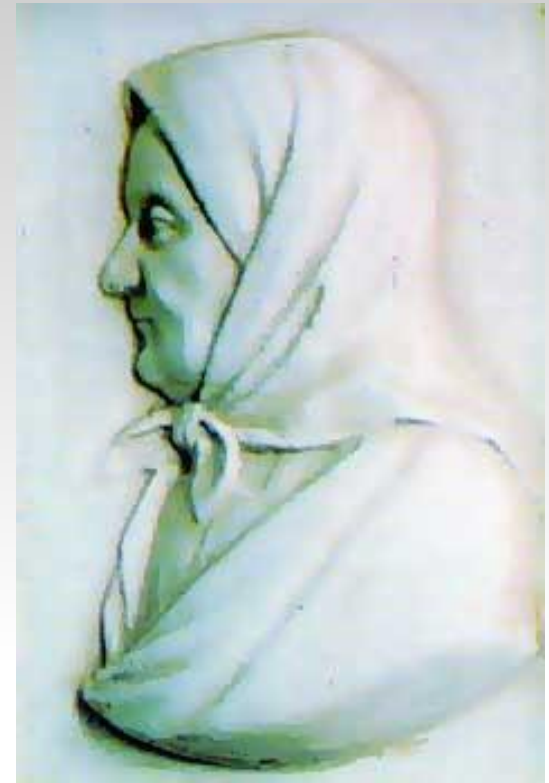
Яковлева Арина Родионовна

Любовь к родному языку маленькому Пушкину привили бабушка, Мария Алексеевна Ганнибал, превосходно говорившая и писавшая по-русски, и няня Арина Родионовна.