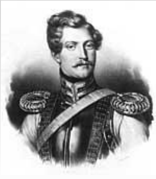
Ж. Дантес-Геккерн. 1830-е гг.

В начале 1834 г. в Петербурге появился француз барон Дантес. Он влюбился в жену Пушкина и стал за ней ухаживать.