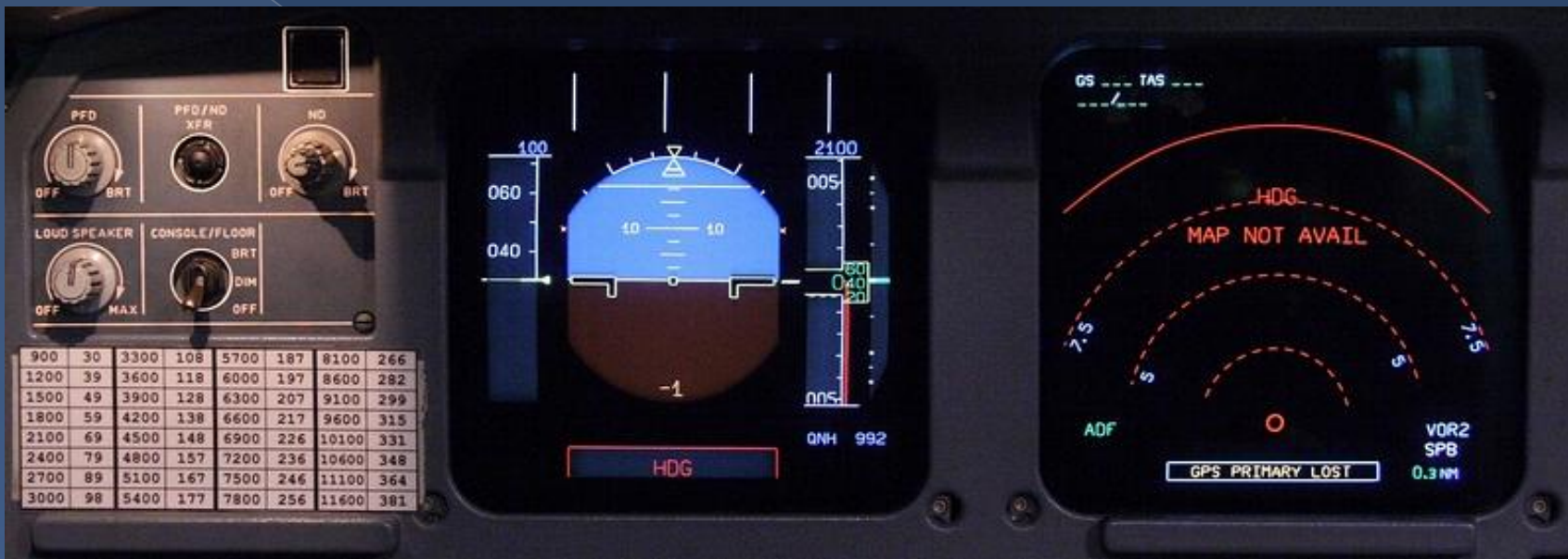
Приборная панель КВС