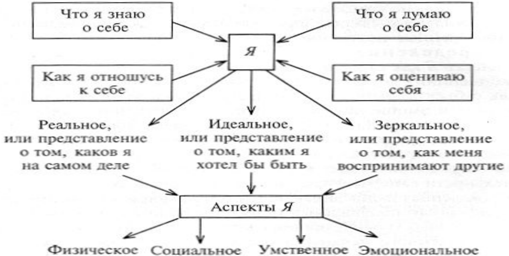
Рис. 3. Структура Я-концепции