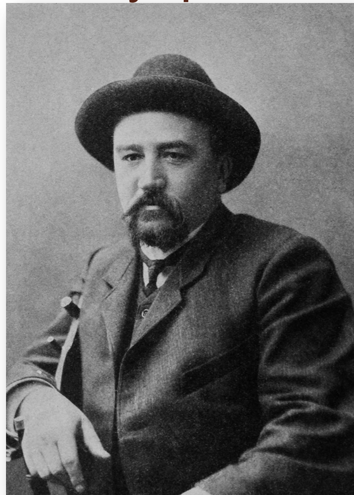
Александр Иванович Куприн