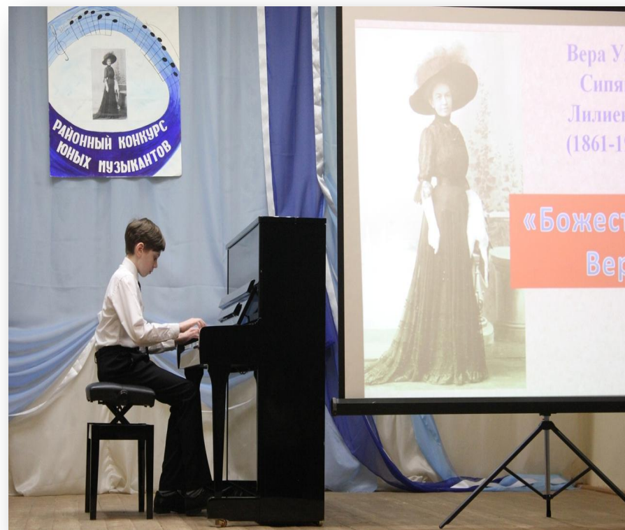
Районный конкурс юных музыкантов февраль 2020

Я тоже буду участвовать в этом конкурсе в