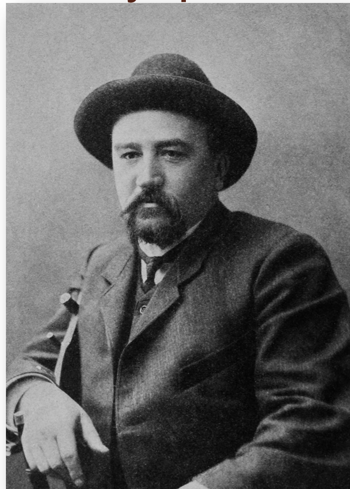
Александр Иванович Куприн