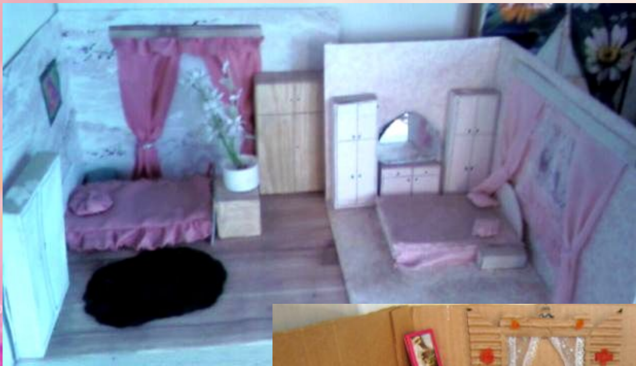
Интерьер моей комнаты.