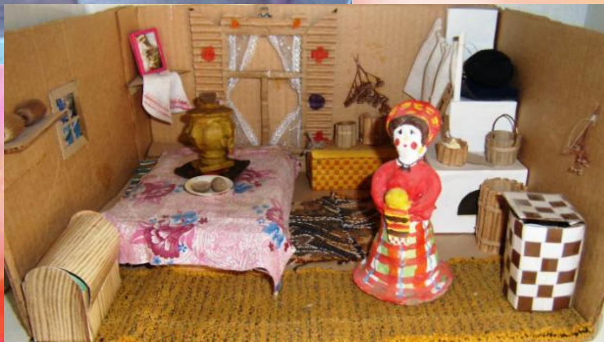
В русской избе.