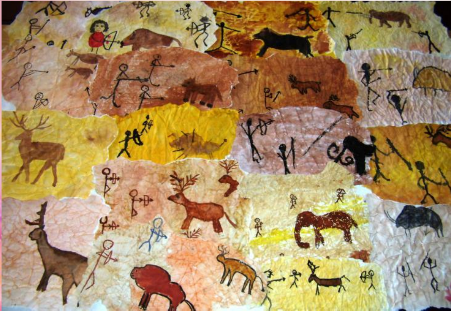
Охота на бизонов.