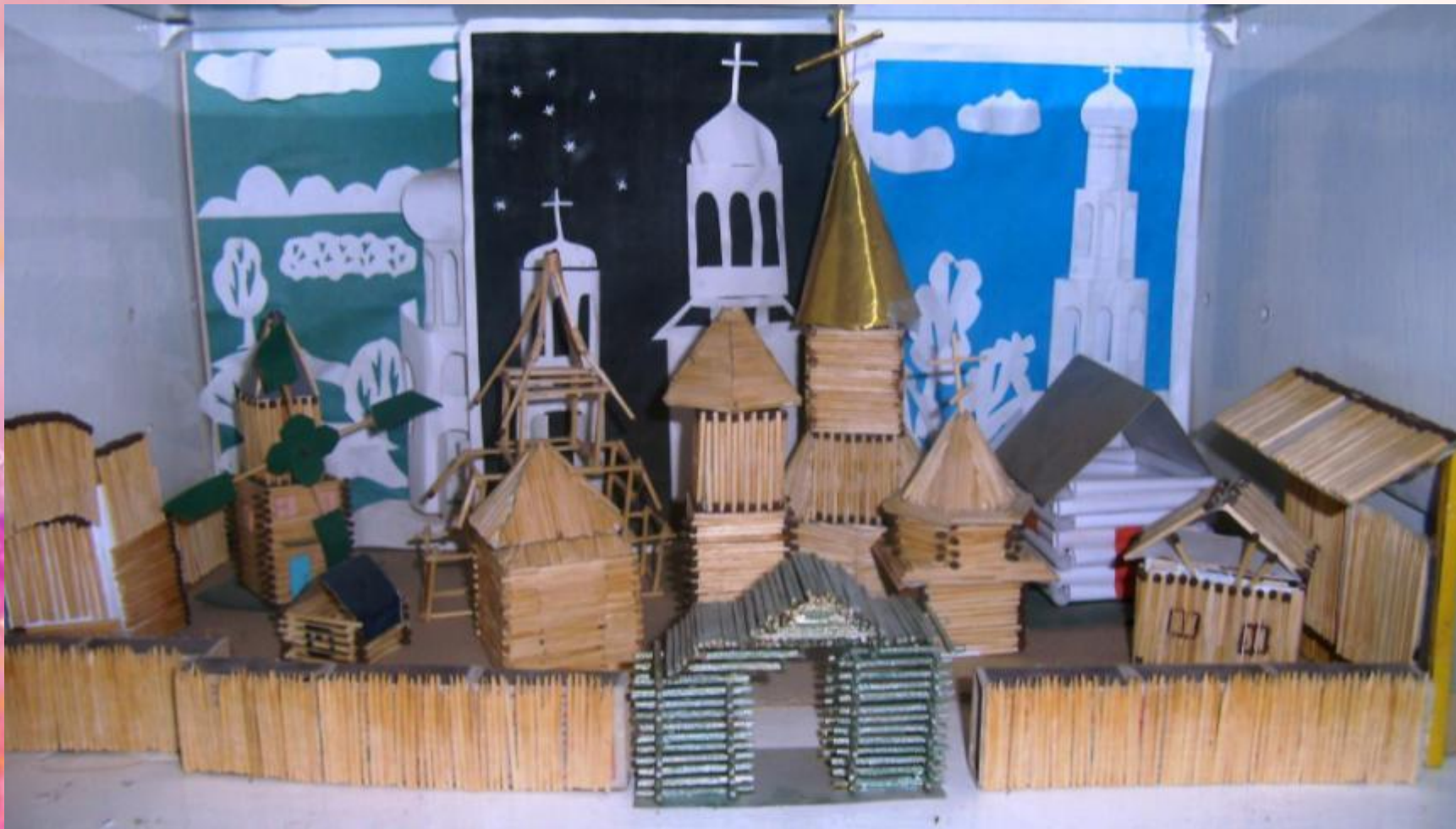
Старая русская крепость.