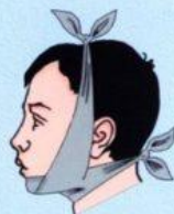
Челюсти (працевидная повязка)