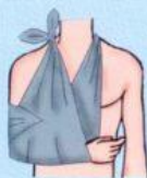
Ключицы и лопатки