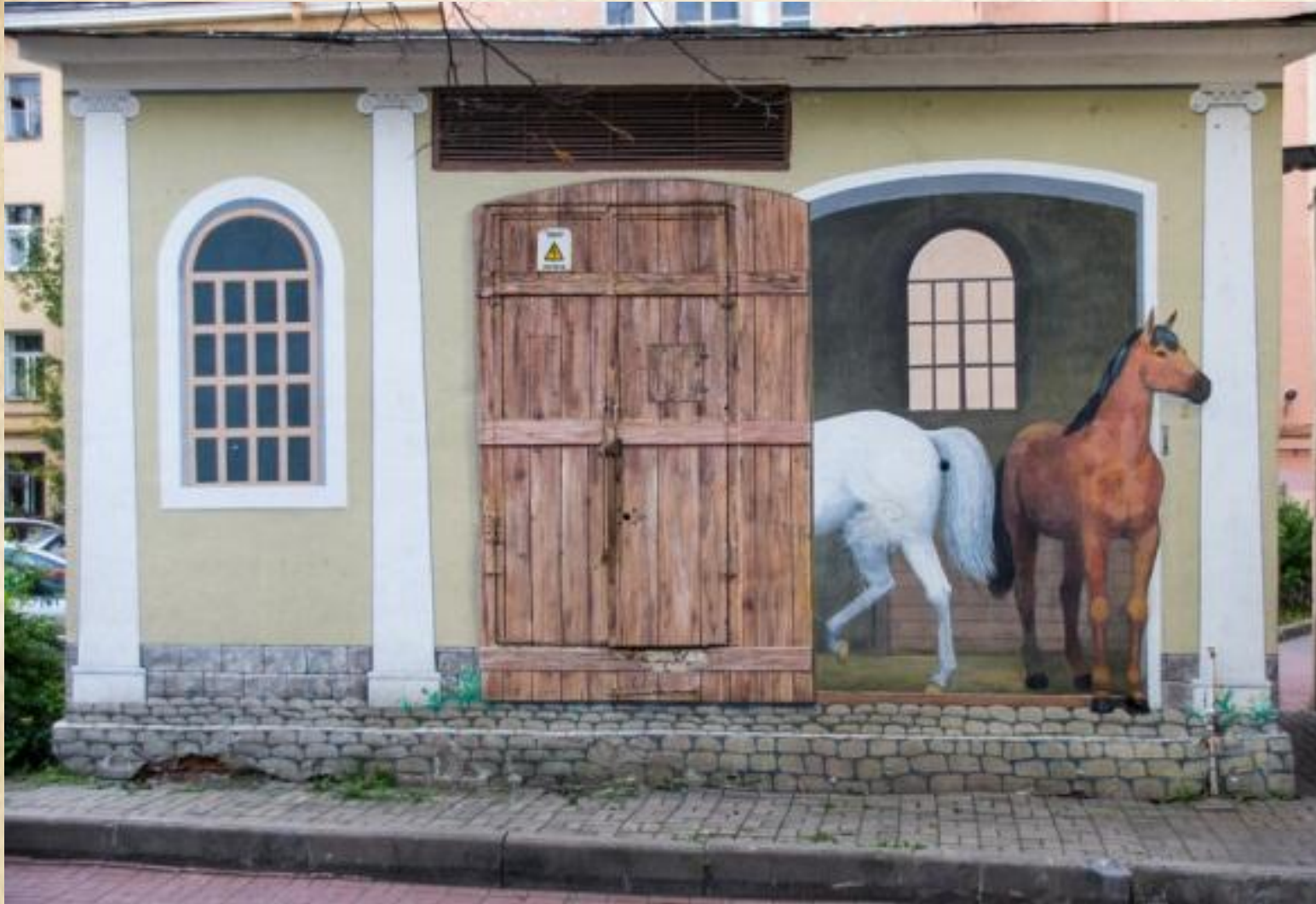
Конюшня. Граффити. Гвардейский дворик. Дойников переулоч, д 26.