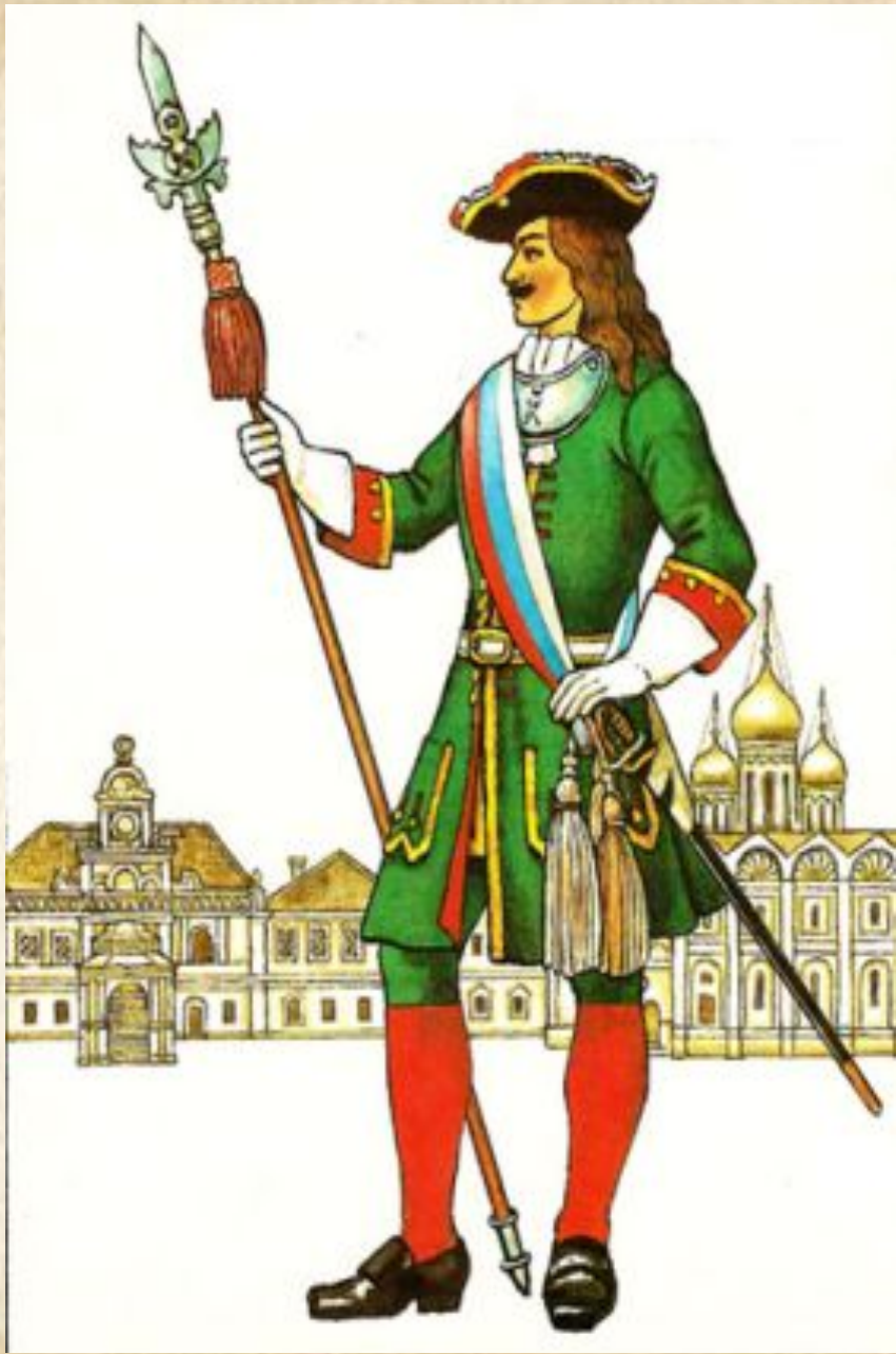
Форма солдата Семёновского полка в 1770-1740 гг.