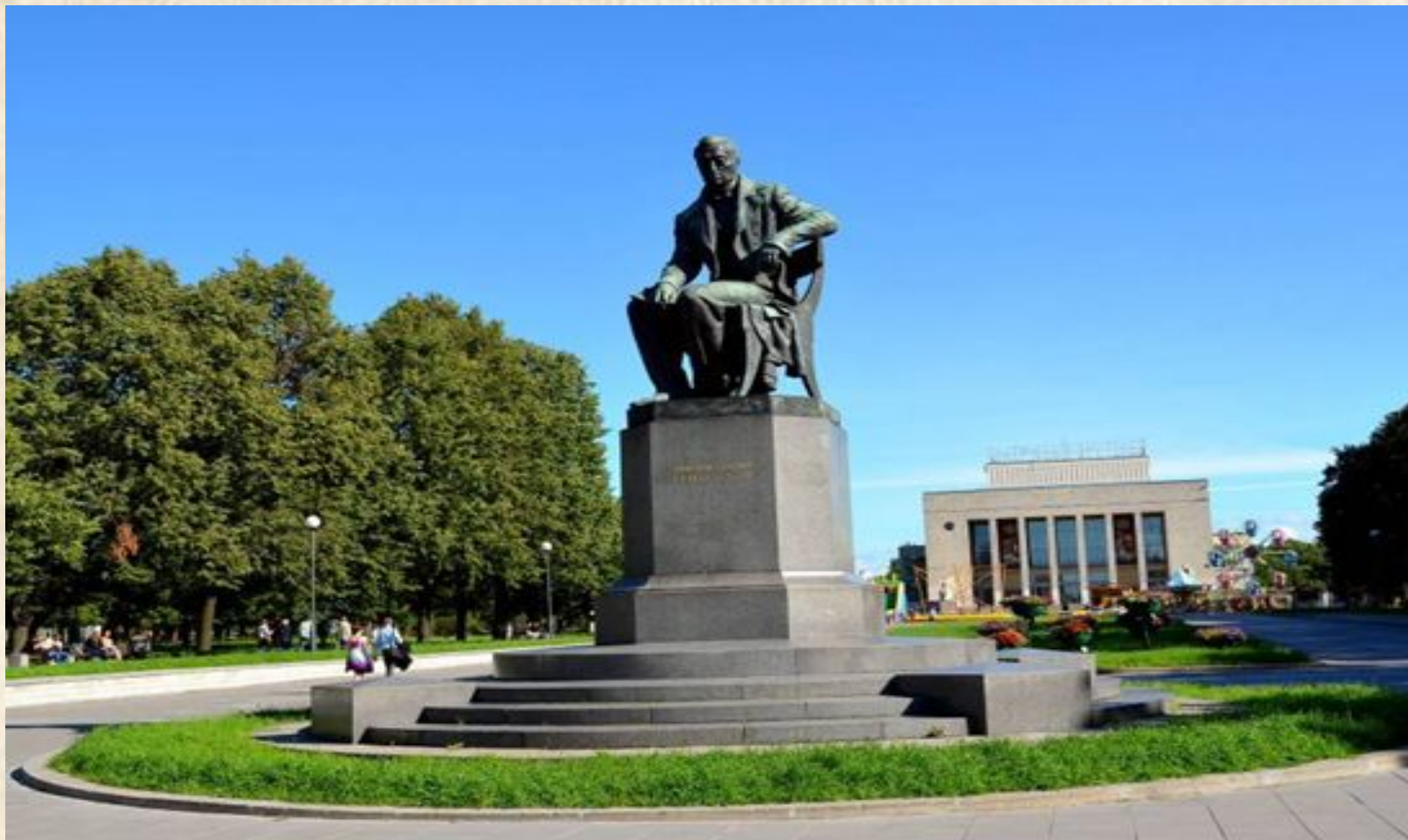
Памятник А.С. Грибоедову. 1959 г. Скульптор В.В. Лишев, архитектор В.И. Яковлев