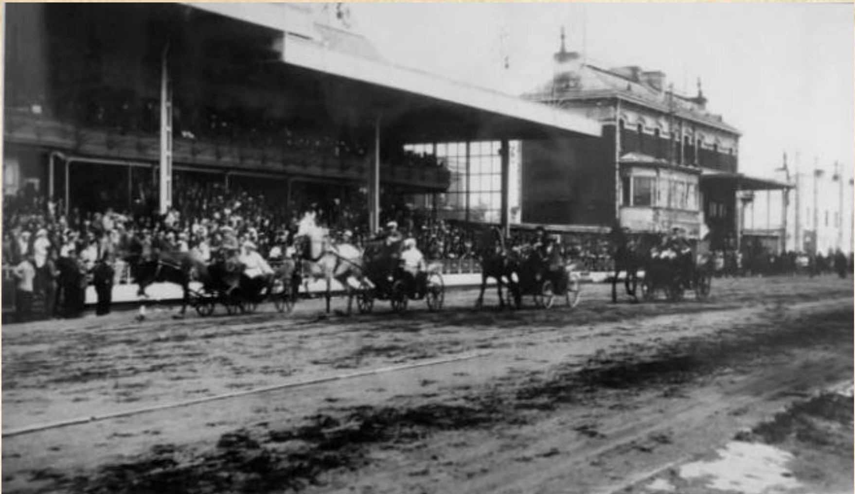
Ипподром на Семеновском плацу. Фото 1924 г.