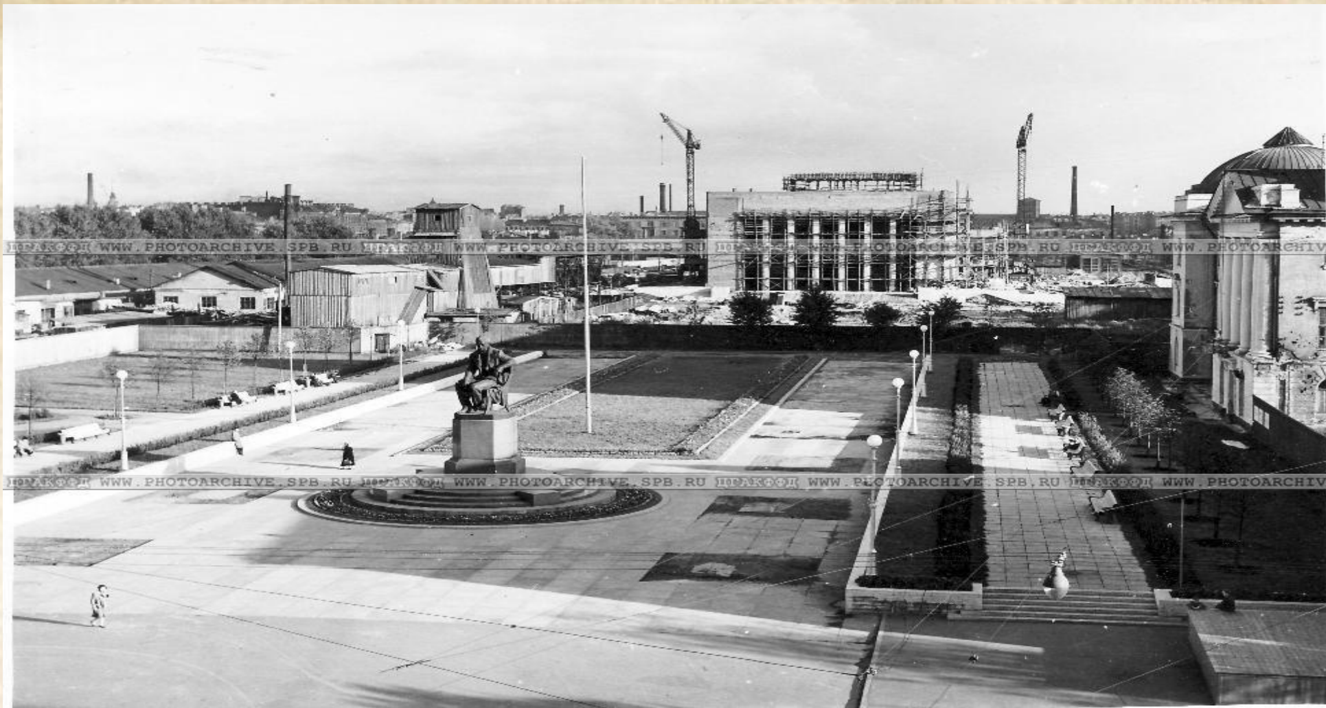
Пионерская площадь. Фотография начала 1950-х гг.