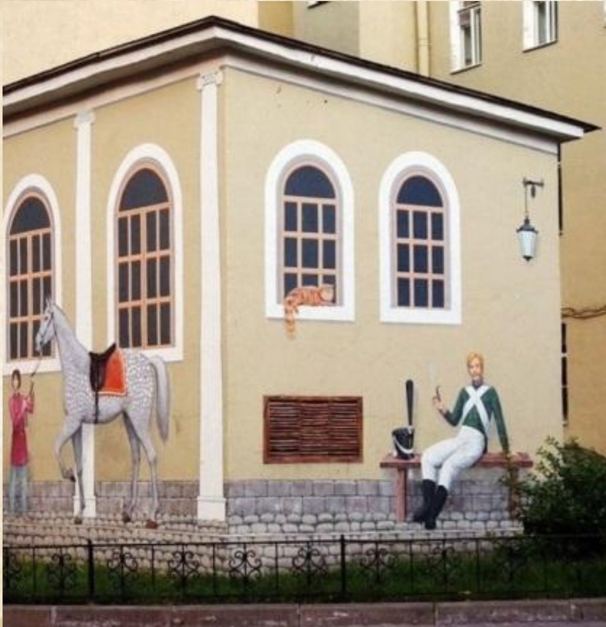
Гвардейский дворик. Граффити.. Дойников переулок, д 26.