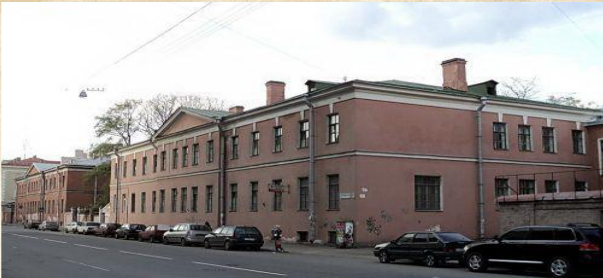
Рузовская улица, дома №№ 10-12. Бывшие казармы Семёновского полка