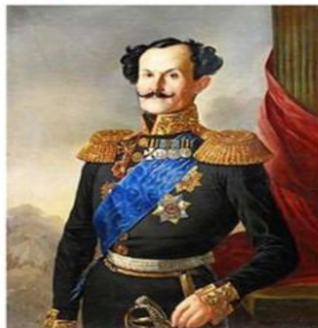
Портрет полковника Шварца

новый Семеновский полк - из других частей Александр I счел бунт проявлением международного революционного заговора