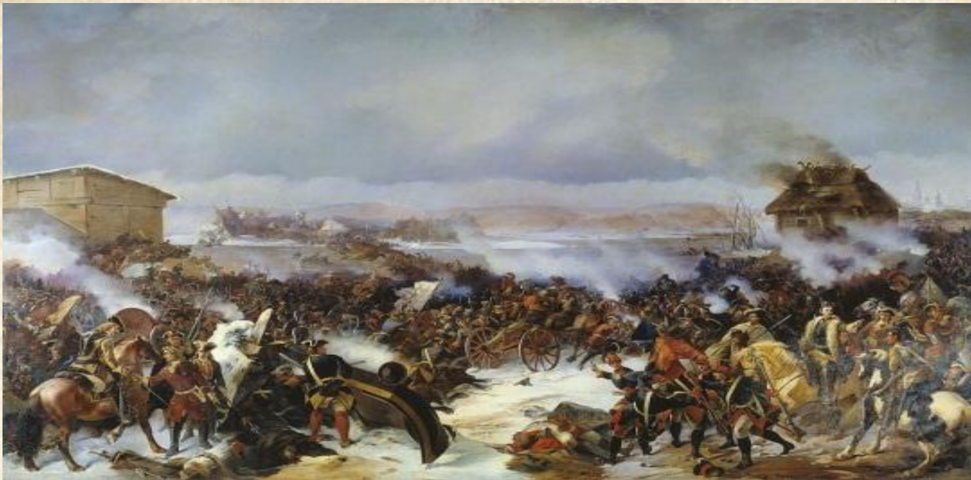
«Сражение под Нарвой 19 ноября 1700 года». Картина художника Коцебу А.Е. 1846 г.