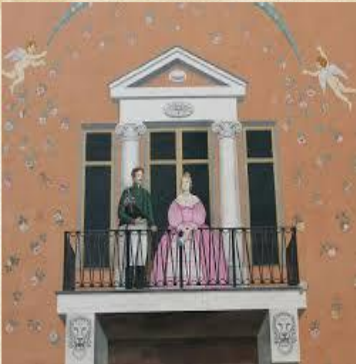
Барышня и офицер. Граффити. Гвардейский дворик. Дойников переулок, д 26.