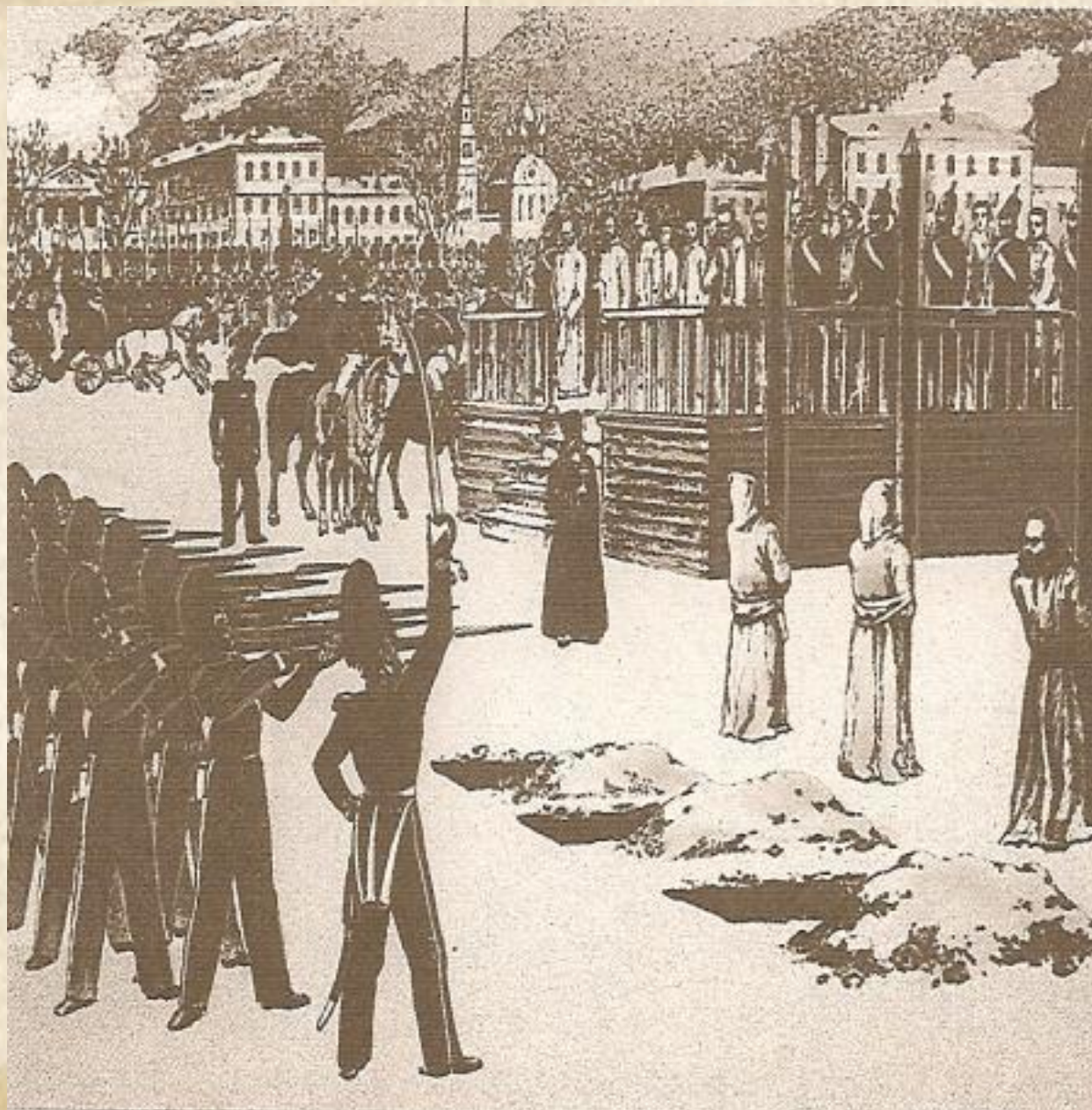
Инсценировка казни петрашевцев. Рисунок Б. Покровского. 1849 г.