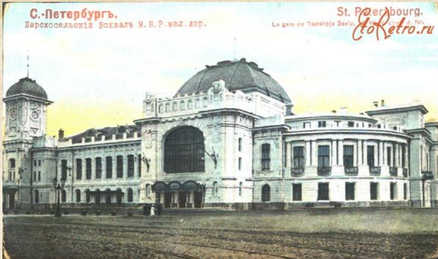
Витебский вокзал. 1904 г. С.А. Бржозовский, С. И. Минаш.