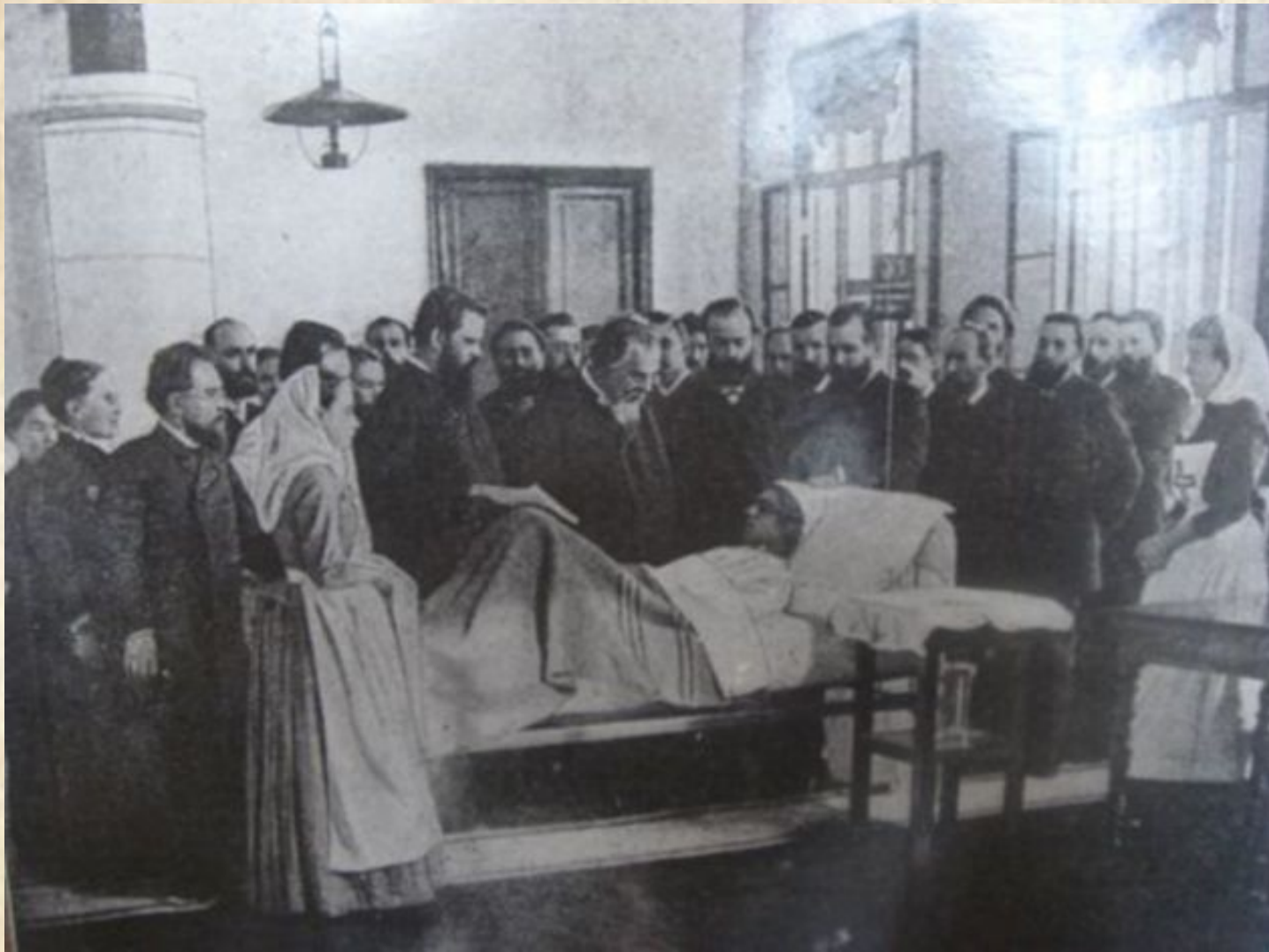
Доктор Боткин проводит занятия для будущих фельдшеров в «Классе лекарских помощников». 1867 г.