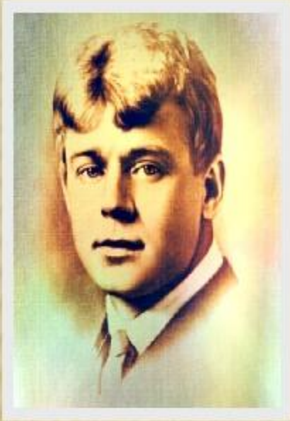
Сергей Александров ич ЕСЕНИН 1895 - 1925