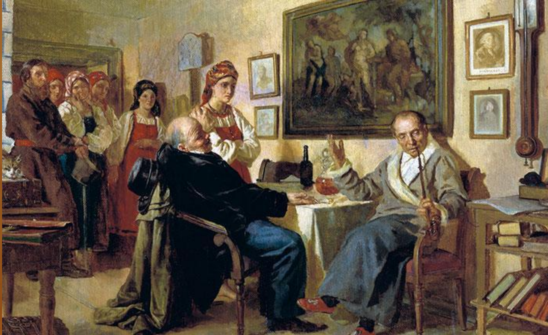
«Торг». 1866 г. Неврев Н. В.