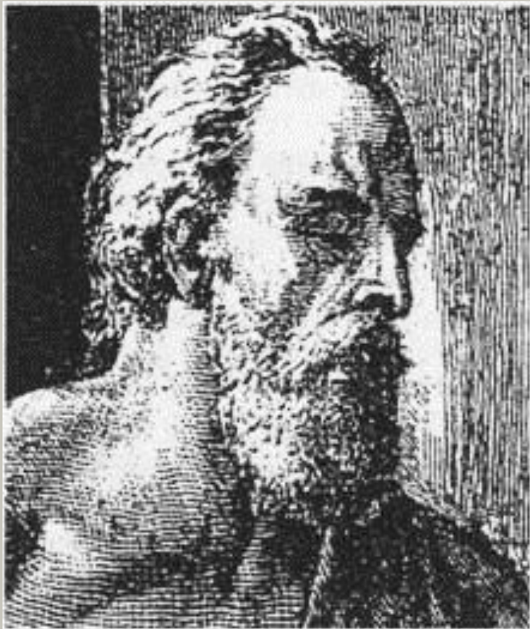
Михаил Глинский. Худ. К. Милер, 1875 г.