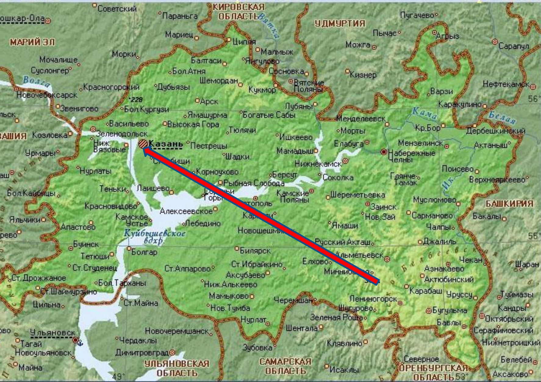
ТАТАРИЯ (РЕСПУБЛИКА ТАТАРСТАН)