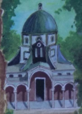
Церковь на Горе Блаженства