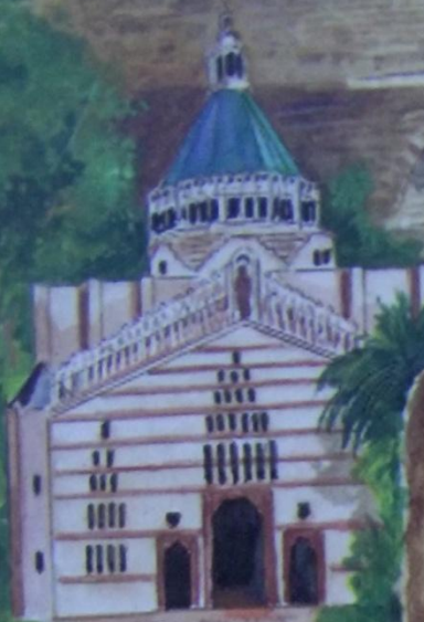
Назарет Церковь Благовещения