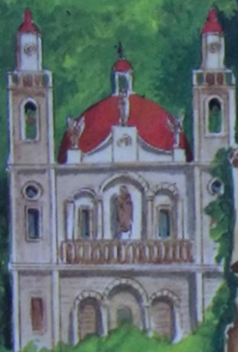
Кана Греческая Православная церковь