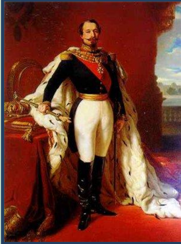
Шарль-Луи Наполеон Бонапарт.

Франции. В 1849г. президентом французской республики был избран Луи Наполеон «маленький племянник большого дяди», как его называли в народе. Он был честолюбив и мечтал о троне. В 1851г. Луи Наполеон потребовал удалить из Конституции статьи, ограничивающие продолжительность его власти. Не получив поддержки в Законодательном собрании, он совершил государственный переворот – распустил Законодательное собрание и взял всю полноту власти в свои руки.