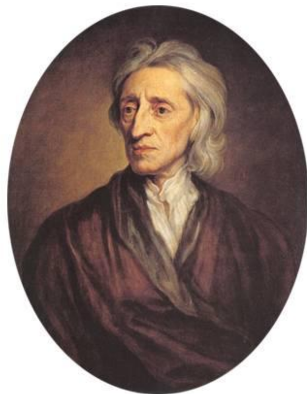
Джон ЛОКК John Locke (1632-1704)