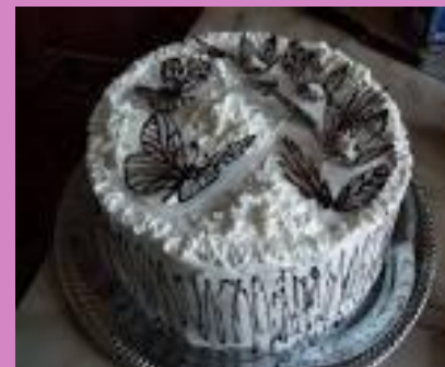
украшение на торт