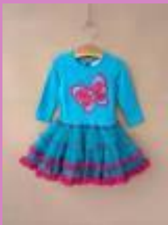
Аппликация на одежде