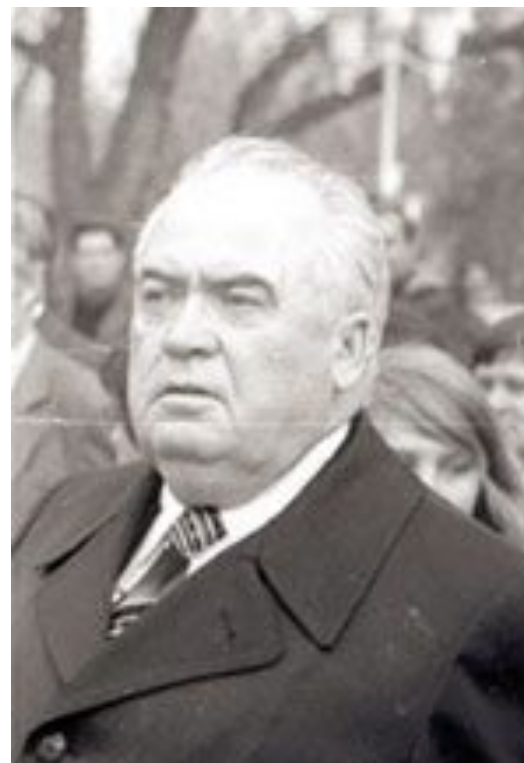
Сергей Фёдорович Медунов Первый секретарь Краснодарского крайкома КПСС