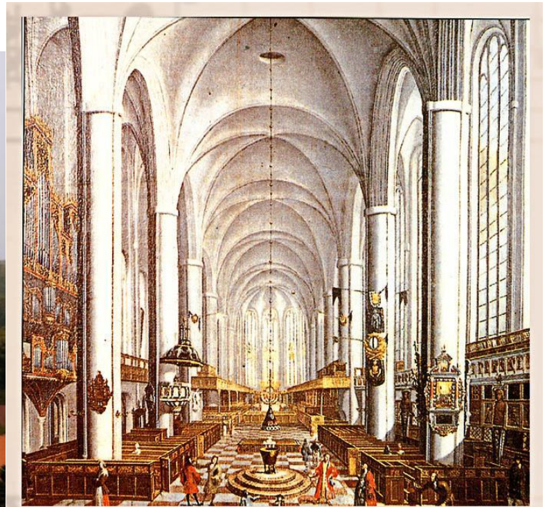
Церковь Святого Михаила в Люнебурге