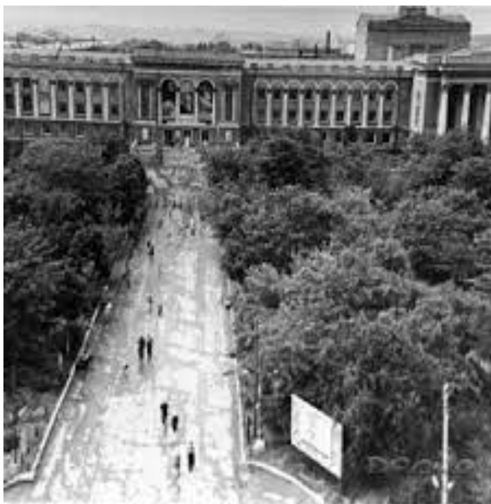
Дворец культуры в городском парке