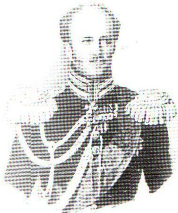
Граф А.Х. Бенкендорф, генерал, шеф корпуса жандармов.

Из письма А.С.Пушкина шефу корпуса жандармов А.Х.Бенкендорфу: «Генерал! Обстоятельства принуждают меня уехать на 2-3 месяца в Нижегородское имение – мне хотелось бы воспользоваться этим и съездить в Оренбург и Казань. Прошу его величество позволить мне ознакомиться с архивами этих документов».