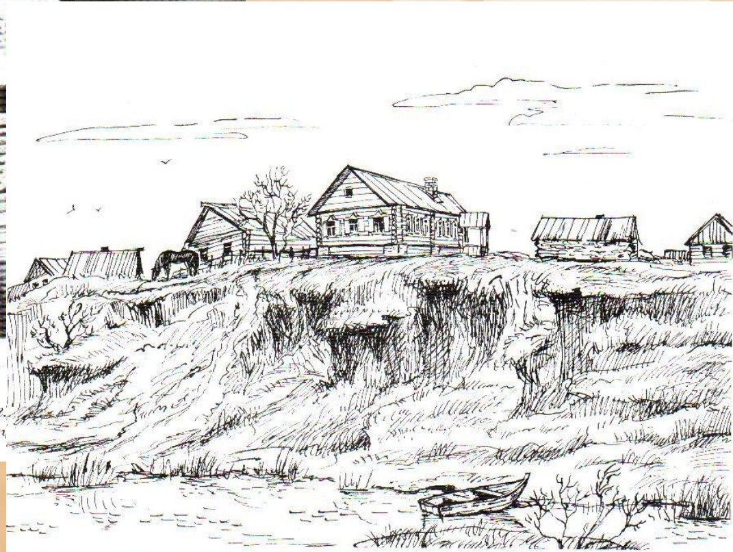
Берды. Дом, в котором с 4 ноября 1773 по 23 марта 1774 г. находилась ставка Е.И. Пугачева. В этом доме жил Пугачев. Рисунок О. Козловской. Тушь.