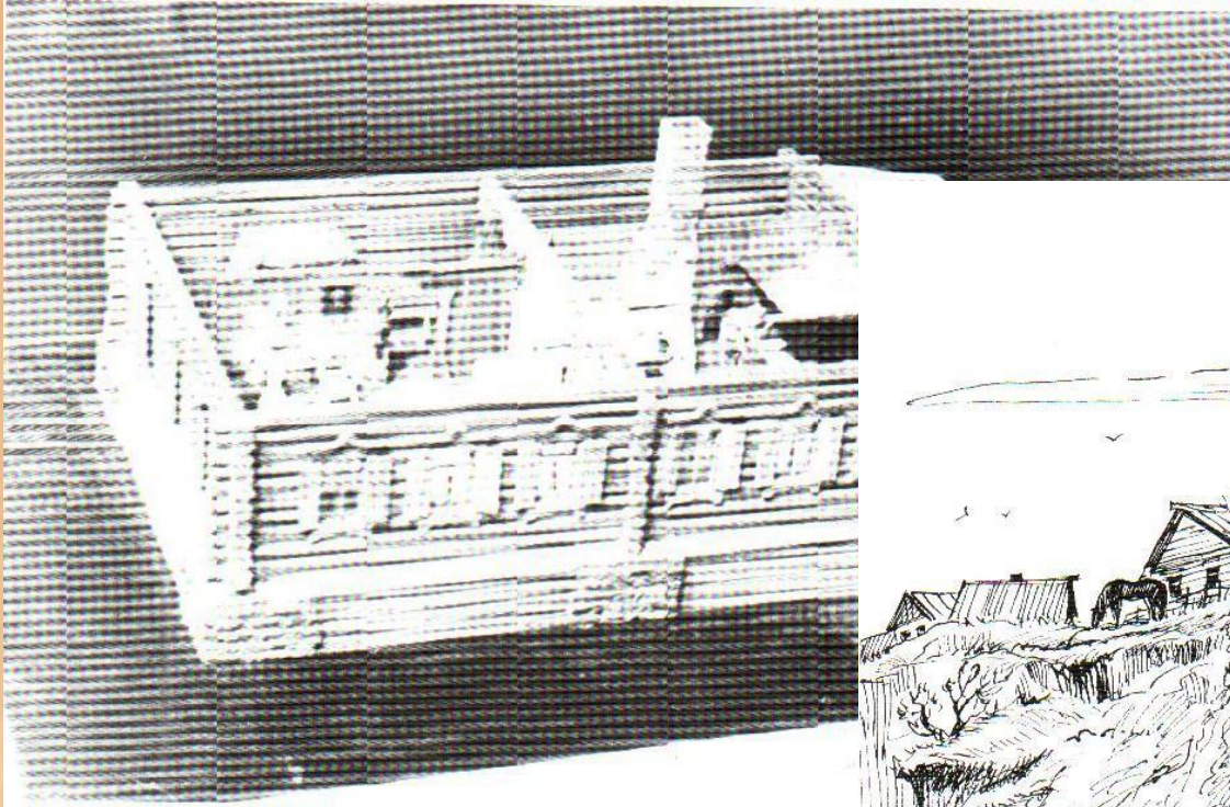
Макет дома «Золотая палата» в Бердах, где находился штаб повстанческой армии. В этом доме жил Емельян Пугачев.

На второй день своего визита в Оренбург Пушкин едет с Далем в крепость Берды.