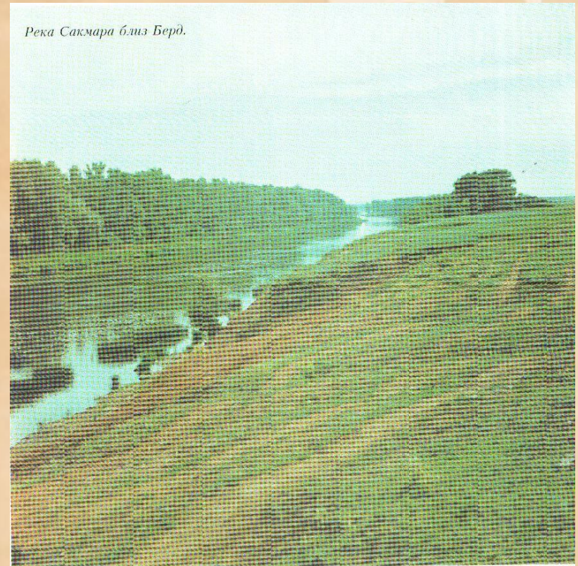
Река Сакмара близ Берд.

«Вот и Оренбург – последняя цель моего путешествия!» – воскликнул Пушкин, подъезжая к Сакмарским воротам.