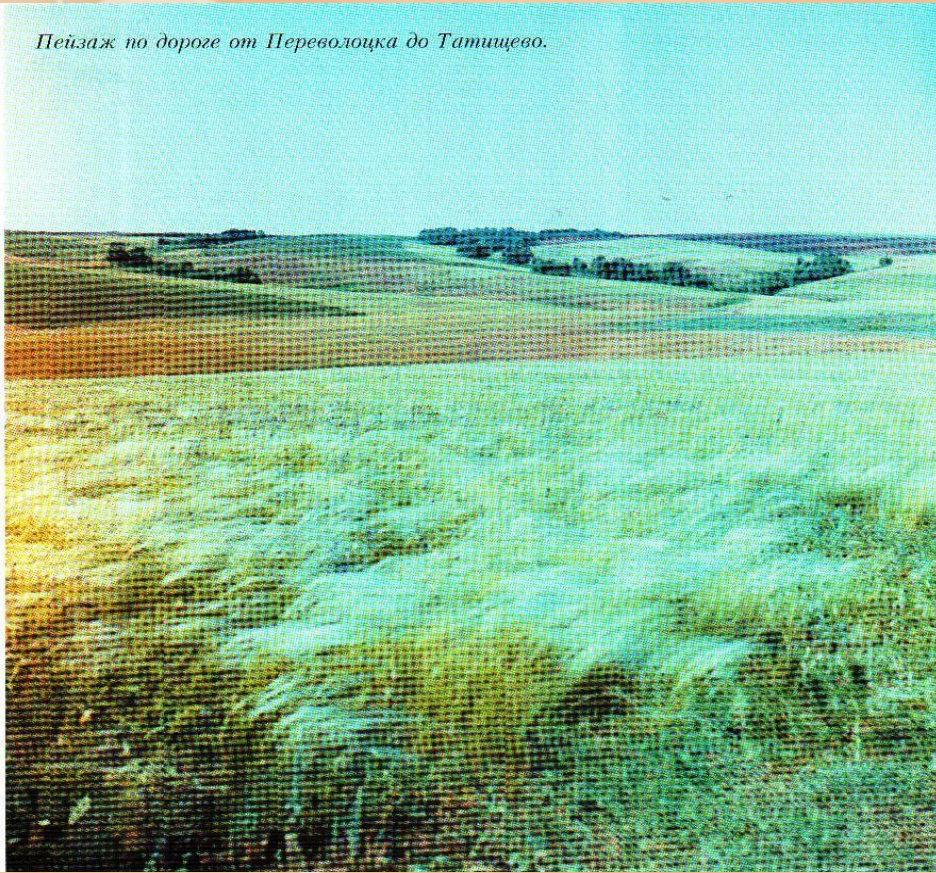
Пейзаж по дороге от Переволоцка до Татищево.