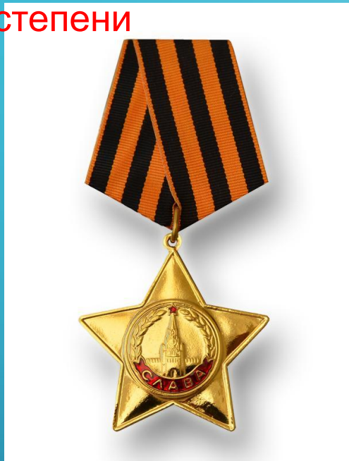
Орден Славы I степени