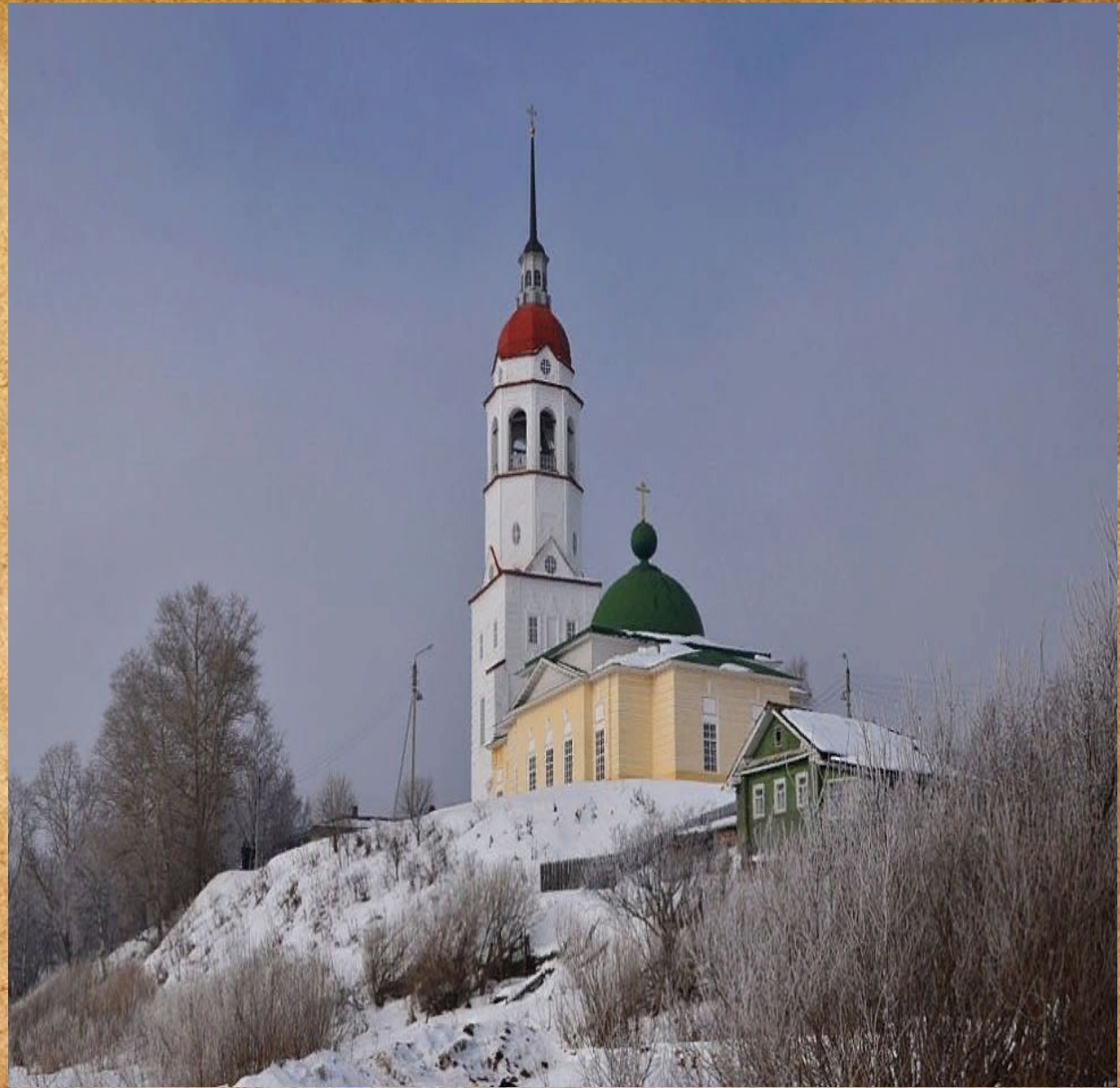
Церковь Успения Пресвятой Богородицы