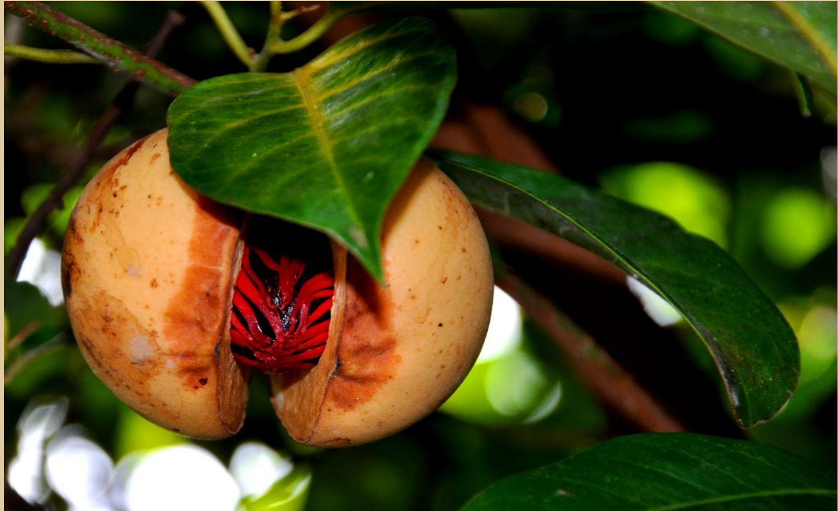
Myristica moschata Thunb.