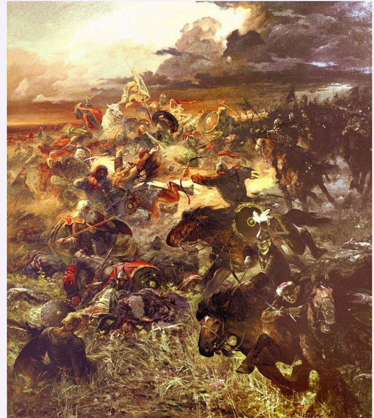
«Слово о полку Игореве».