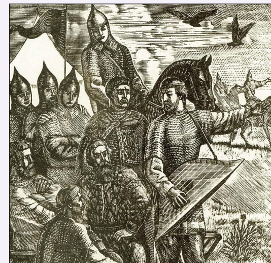
«Слово о полку Игореве». Гравюра В.А. Фаворского. 1952 г.