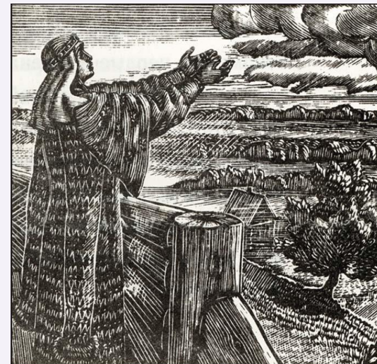
«Слово о полку Игореве». Гравюра В.А. Фаворского. 1952 г.