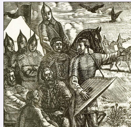
«Слово о полку Игореве». Гравюра В.А. Фаворского. 1952 г.