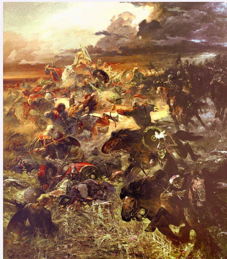
«Слово о полку Игореве». Назарук В.М. «Битва» (1985 г.)