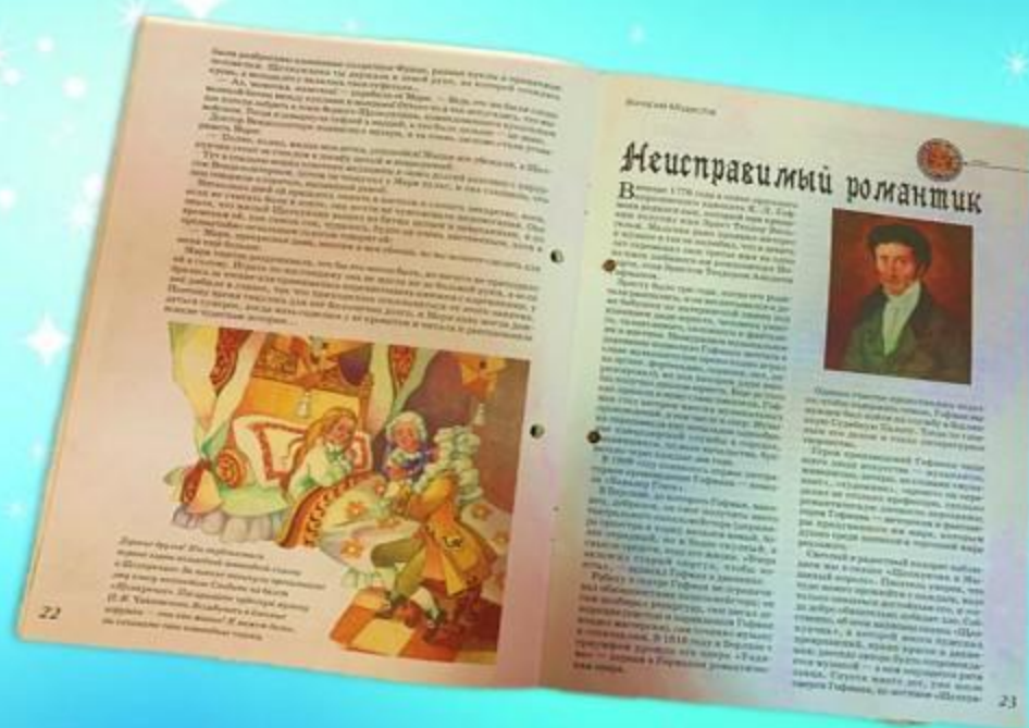
Модестов В. Неисправимый романтик // Детская Роман-газета. - 2011. - №12. - С. 23 - 24.