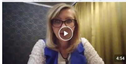
Твой путь к успеху youtu.be