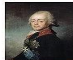
Павел I (1796-1801)