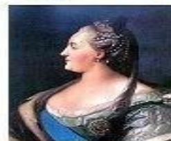
Екатерина II Великая (1762-1796)