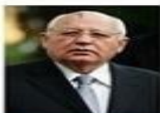
Михаил Горбачев (1985-1991)