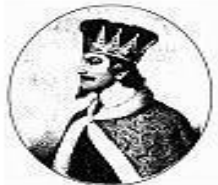
Ярополк Окаянный (1015-1016)