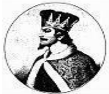
Ярополк Окаянный (1015-1016)