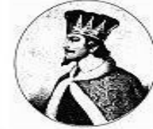
Ярополк Окаянный (1018-1019)

* Двойное княжение Ярополка и Ярослава связано с междоусобной войной между братьями и переходом Киева из рук в руки.