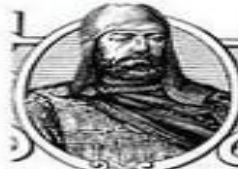
Михаил Хоробрит (1248)