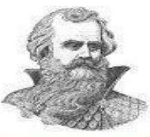
Всеслав Полоцкий (1068-1069)