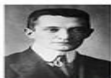
Александр Керенский (1917)