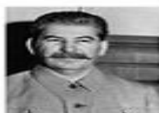
Иосиф Сталин (1922-1953)