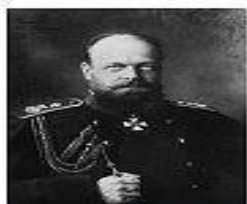
Александр III Миротворец (1881-1894)