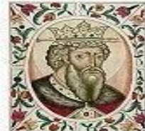
Владимир Святой (978-1015)