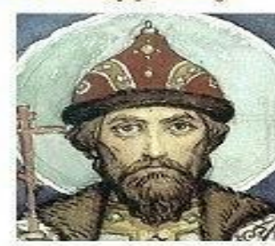
Андрей Боголюбский (1157-1174)

В 1169 году Андрей Боголюбский совершает удачный военный поход на Киев и берет его. Но не берет себе титула Великого князя Киевского, а возвращается во Владимир, оставив в Киеве одного из дальних родственников. С этого времени фактически главным на Руси становится Владимиро-Суздальское княжество.