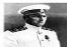
Александр Колчак (1918-1920)

С началом Гражданской войны возникло два центра власти — «Белый» во главе с Колчаком и «Красный» во главе с Лениным.