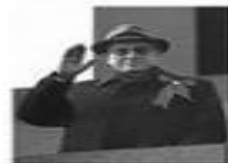
Юрий Андропов (1982-1984)