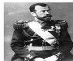
Николай II (1894-1917)