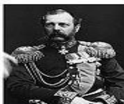
Александр II Освободитель (1855-1881)