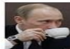
Владимир Путин (2000-2008)