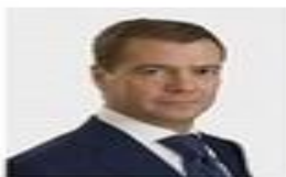
Дмитрий Медведев (2008-2012)