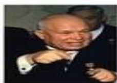
Никита Хрущев (1953-1964)