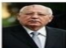
Михаил Горбачев (1985-1991)