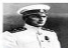
Александр Колчак (1918-1920)

С началом Гражданской войны возникло два центра власти — «Белый» во главе с Колчаком и «Красный» во главе с Лениным.