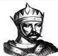
Юрий Долгорукий (1155-1157)