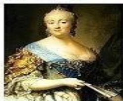
Елизавета Петровна (1741-1761)