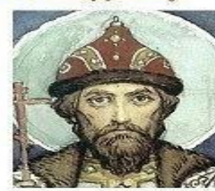
Андрей Боголюбский (1157-1174)

В 1169 году Андрей Боголюбский совершает удачный военный поход на Киев и берет его. Но не берет себе титула Великого князя Киевского, а возвращается во Владимир, оставив в Киеве одного из дальних родственников. С этого времени фактически главным на Руси становится Владимиро-Суздальское княжество.