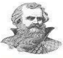
Всеслав Полоцкий (1068-1069)