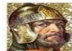
Александр Невский (1252-1263)