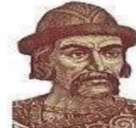
Ярослав Мудрый (1016-1018)