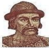
Ярослав Мудрый (1019-1054)

* Двойное княжение Ярополка и Ярослава связано с междоусобной войной между братьями и переходом Киева из рук в руки.