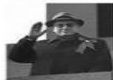
Юрий Андропов (1982-1984)