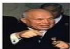
Никита Хрущев (1953-1964)