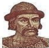
Ярослав Мудрый (1019-1054)

* Двойное княжение Ярополка и Ярослава связано с междоусобной войной между братьями и переходом Киева из рук в руки.