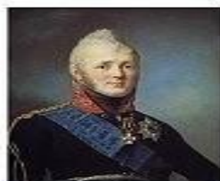
Александр I Благословенный (1801-1825)