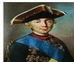
Петр III (1761-1762)