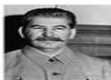
Иосиф Сталин (1922-1953)