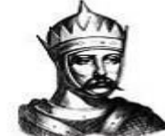
Юрий Долгорукий (1149-1151)