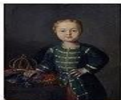
Иван VI (1740-1741)