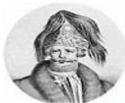
Мстислав Великий (1125-1132)