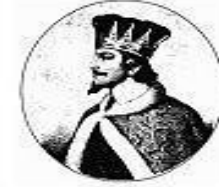
Ярополк Окаянный (1018-1019)

* Двойное княжение Ярополка и Ярослава связано с междоусобной войной между братьями и переходом Киева из рук в руки.