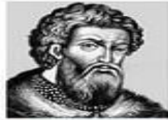
Всеволод Большое Пнездо (1176-1212)