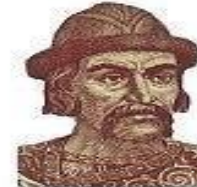
Ярослав Мудрый (1016-1018)