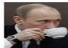
Владимир Путин (2000-2008)