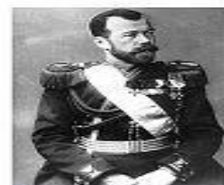
Николай II (1894-1917)