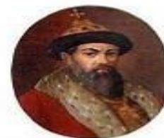
Владимир Мономах (1113-1125)