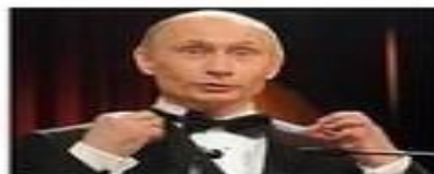
Владимир Путин (2012-?)