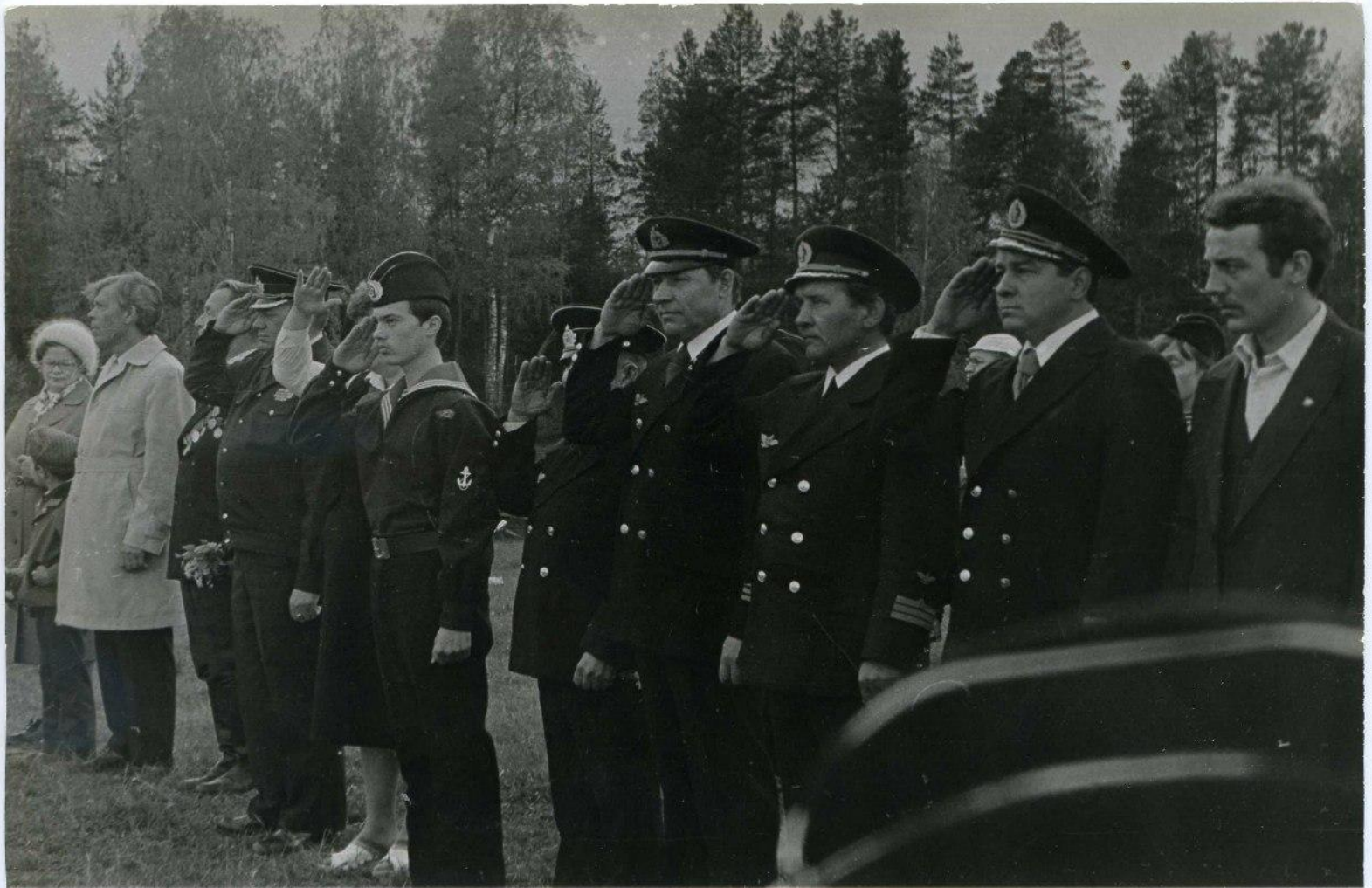
На линейке в честь открытия смены.