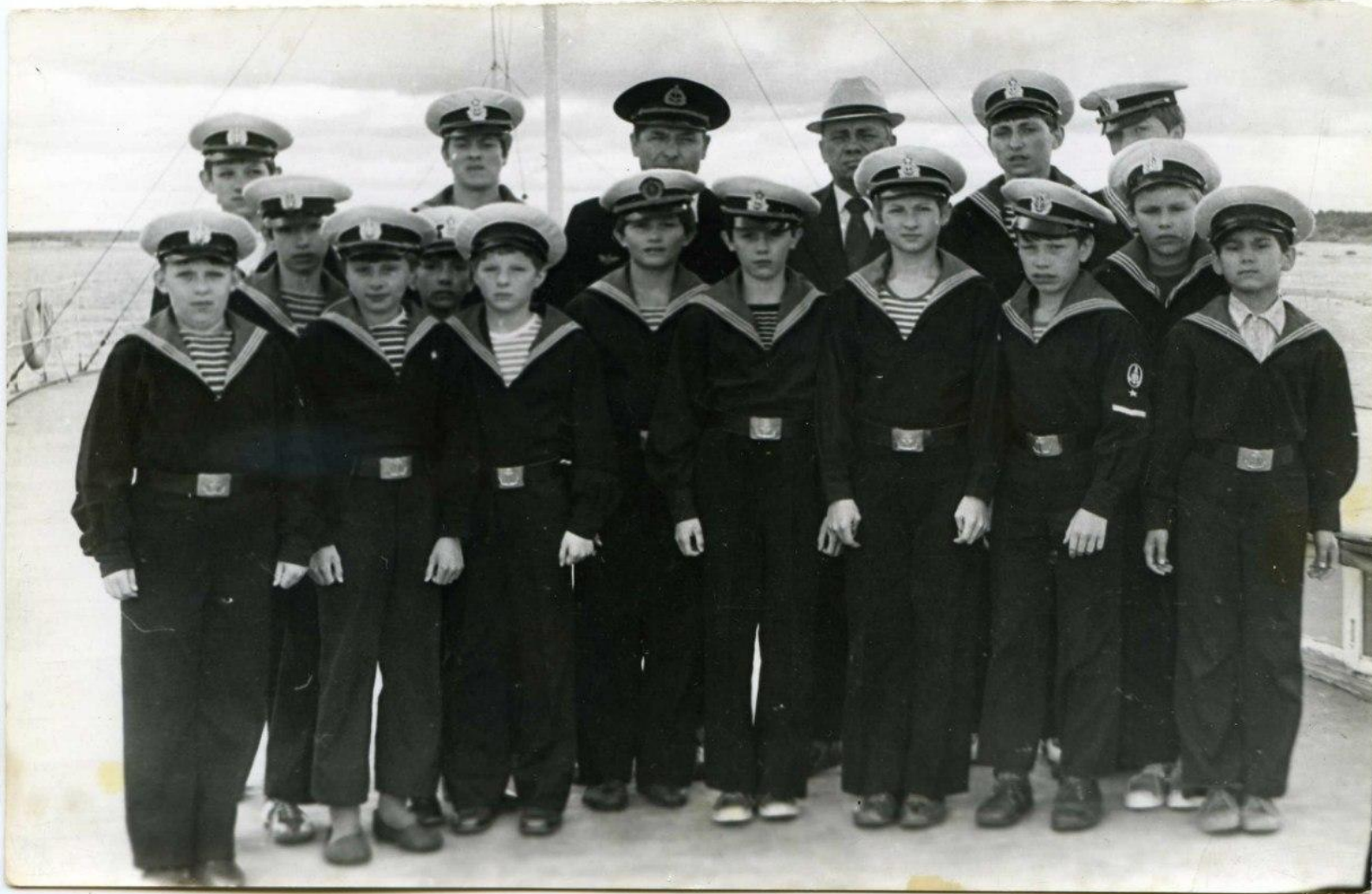
Клуб юных моряков и речников.