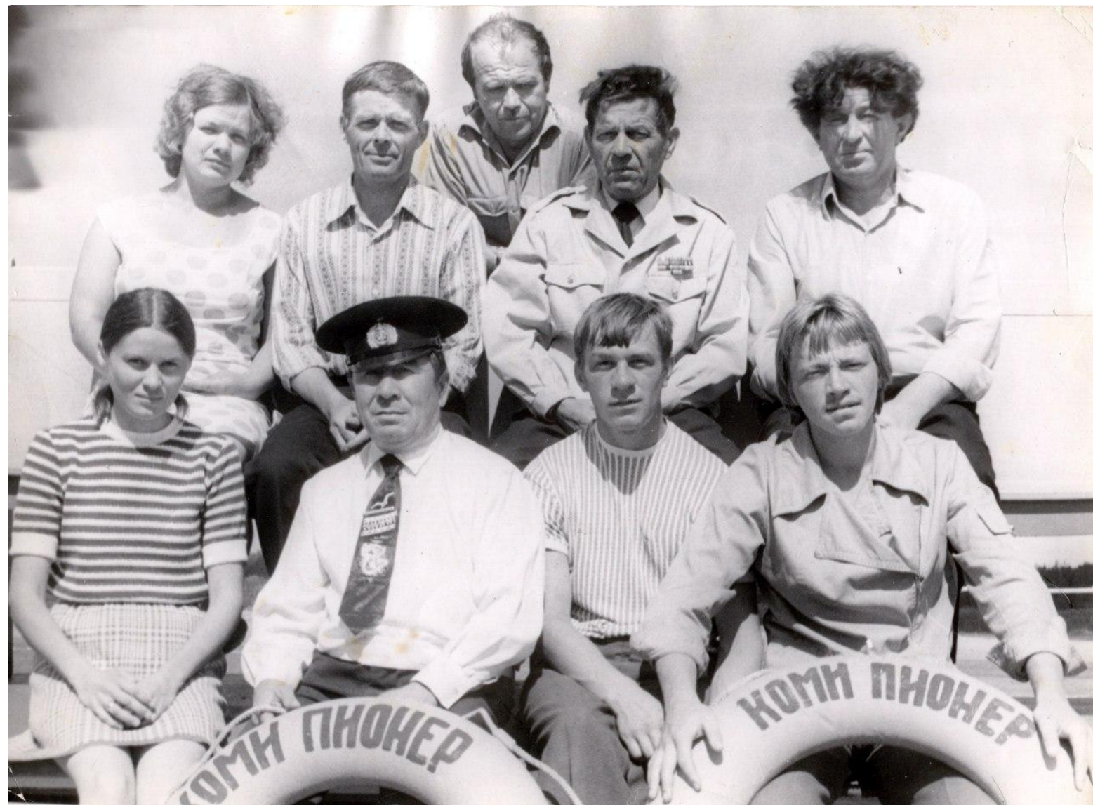
Команда «Коми Пионера» 1971 год