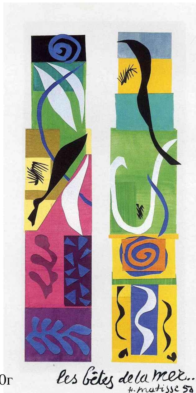
Анри Матисс «Морские животные», 1950г