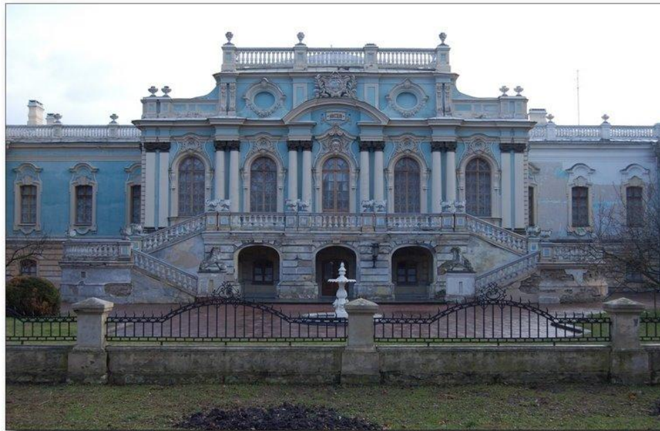
Мариинский дворец 21.01.2007