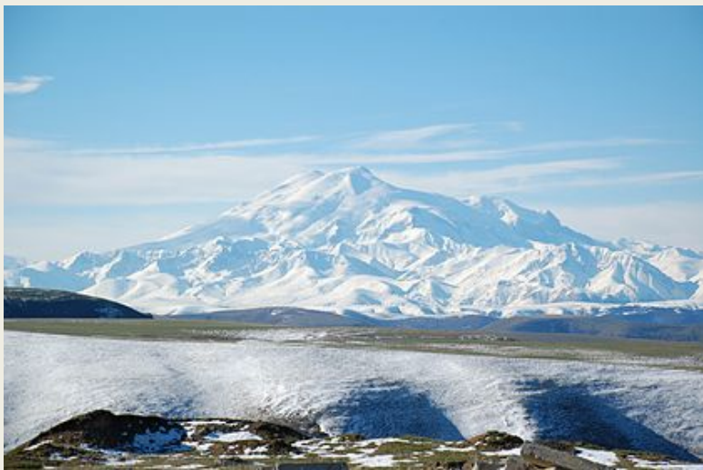
Эльбрус. Извержение около 45 тысяч лет назад.