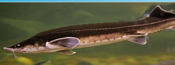
Џтерлӑк - Стерлядь