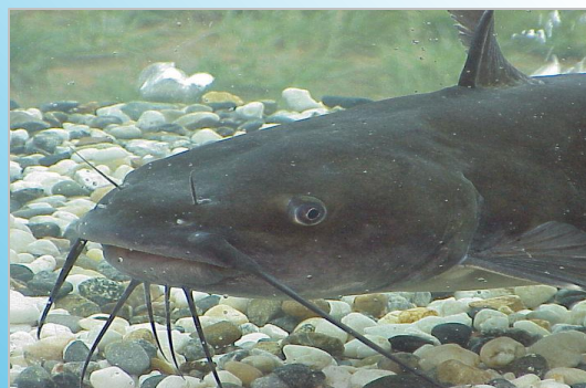
Џуйӑн - Сом