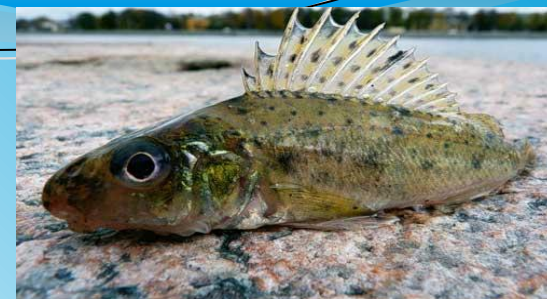
Ёрш — кӑртӑш