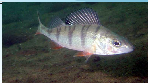
Окунь - уланкӑ