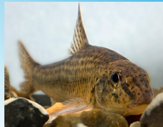
Пескарь - ыраш пӑтри