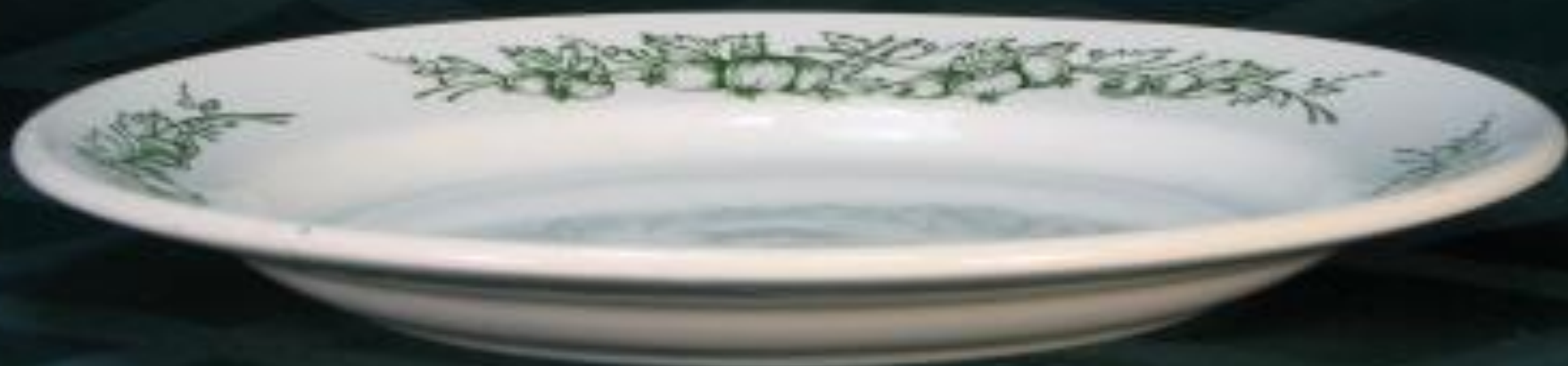
ГЛУБОКАЯ - МЕЛКАЯ