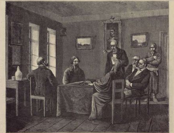
Картина земства. Земская Уездная Управа. № 15.