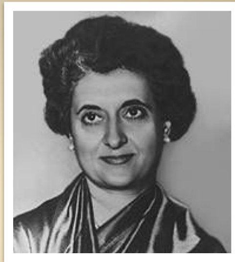
Индира Ганди (1964)